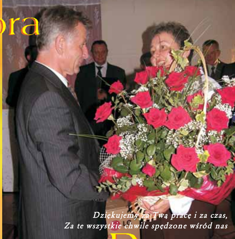
Dziękujemy za Twoją pracę i za czas, Za te wszystkie chwile spędzone wśród nas