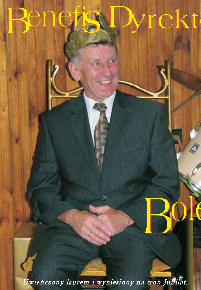
Uwieńczony laurem i wyniesiony na tron Jubilat.