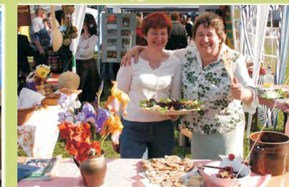
Stoisko Nadbystrzyckiego Stowarzyszenia Agroturystycznego serwowało regionalne przysmaki