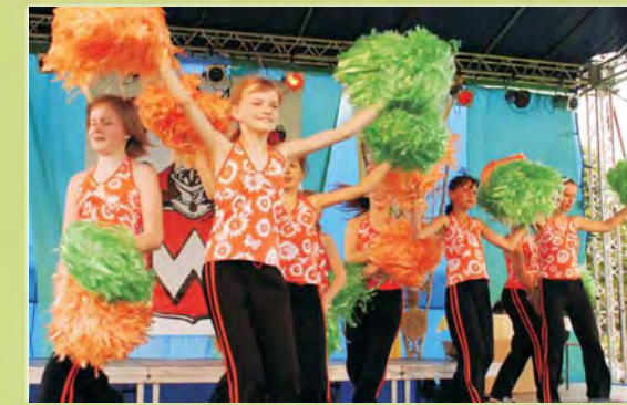
Chirliderki ze Szkoły Podstawowej z Żabiej Woli