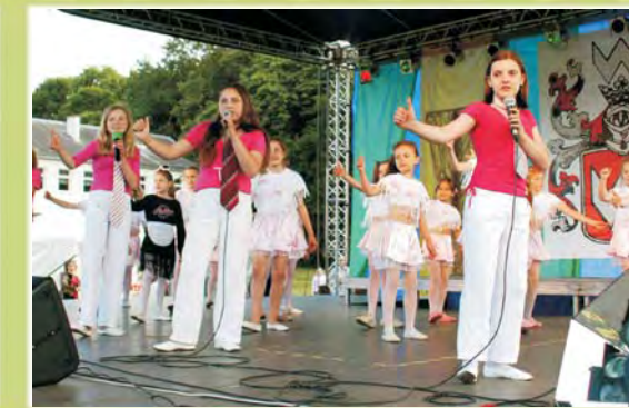
Mali i trochę więksi członkowie zespołu Wiercipięty ze SP w Osmolicach