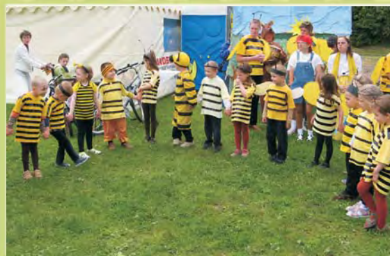
Małe i duże pszczołki czekają na swój występ, czyli przedszkolaki z Piotrowic i wychowankowie DPS z Kielczewic