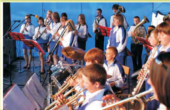
Gminna Młodzieżowa Orkiestra Dęta