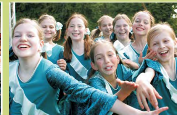
Roześmiany starszy zespół "Migotki" z CKiP w Piotrowicach