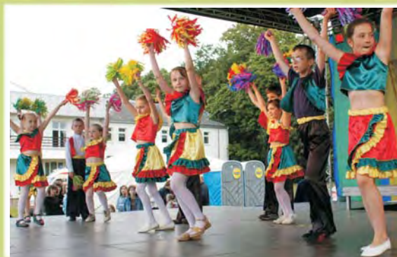
Gorący taniec w wykonaniu zespołu ze SP w Osmolicach