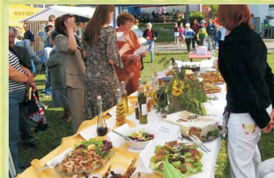
Ciasta, nalewki, potrawy mięsne z dodatkiem miodu- to wszystko oceniała komisja w konkursie kulinarnym