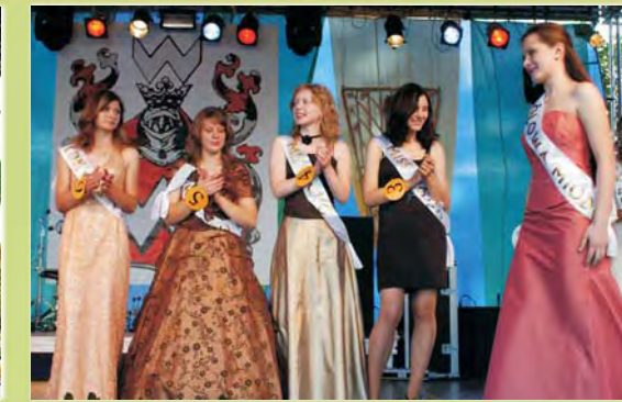
Wdzięk, styl, klasa, urok- tego nie zabrakło dziewczętom podczas tegorocznych wyborów Miss