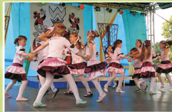
Grupy taneczne ze Szkoły Podstawowej w Bystrzycy Starej