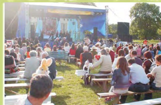
Publiczność nie zawiodła, pogoda również