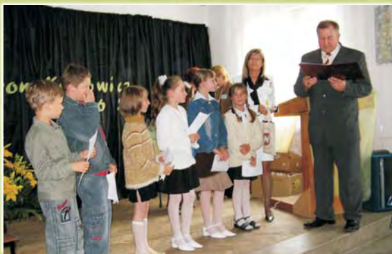
Wręczenie nagród laureatom konkursów Gminnej Olimpiady Ekologicznej