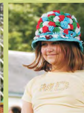
Pokaz bajecznych eko- kapeluszy w wykonaniu ślicznych modelek ze szkół z Osmolic i Bystrzycy Starej