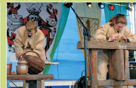
"Obrzęd miodobrania" przygotowany przez uczniów ZSR CKP w Pszczelęj Woli