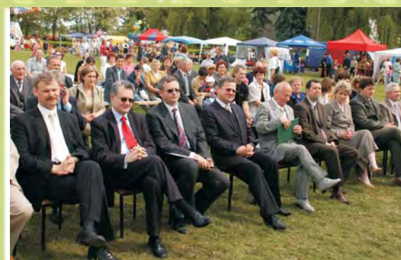
Na takiej imprezie nie mogło zabraknąć władz i gości honorowych