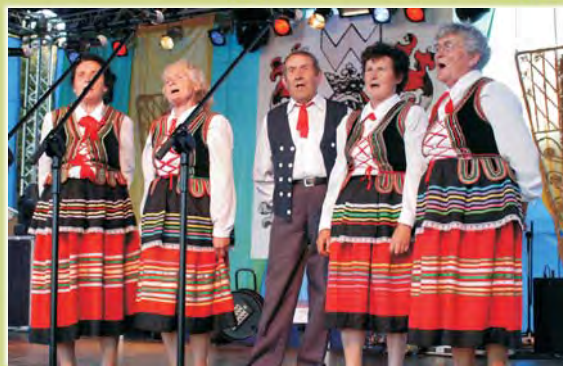
Zespół Śpiewaczy KGW z Kielczewic