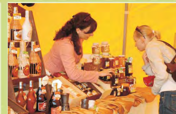
Który miód jest lepszy? Trudny wybór. Stoisko Spółdzielni Pszczelarskiej APIS