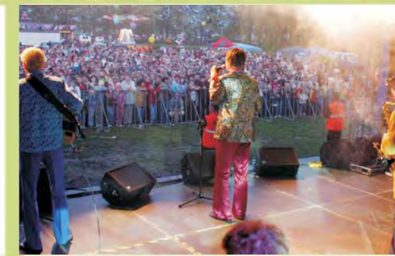
Gwiazda wieczoru- zespół "Leszcze"