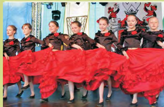
Hiszpańskie rytmy pasują do czarno- czerwonych strojów zespołu Pompon ze SP w Rechcie