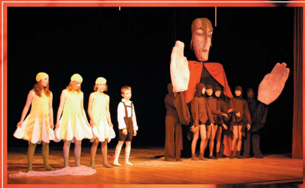
To już Koniec przedstawienia! Teraz jeszcze tylko uklon...