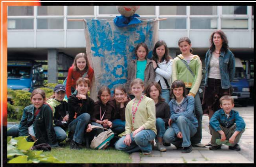
To my teatr Kaprys na dziedzińcu Domu Chemika w Puławach