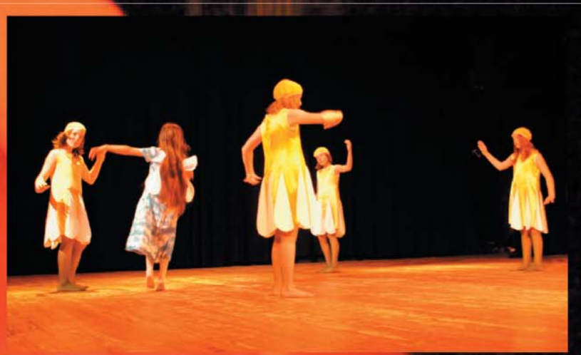
Kwiaty wraz z Rusalką w tanecznej pantomimie