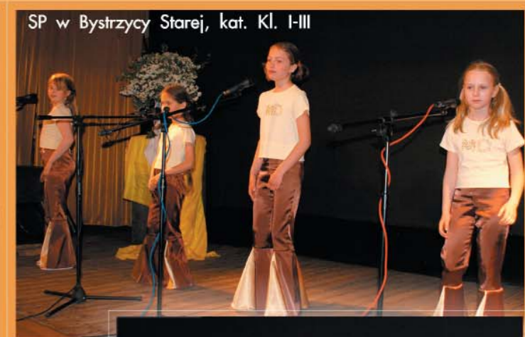
SP w Bystrzycy Starej, kat. Kl. I-III

O festiwalowych zmaganiach czytaj na stronie 6 Obok prezentujemy zdjęcia uczestników.