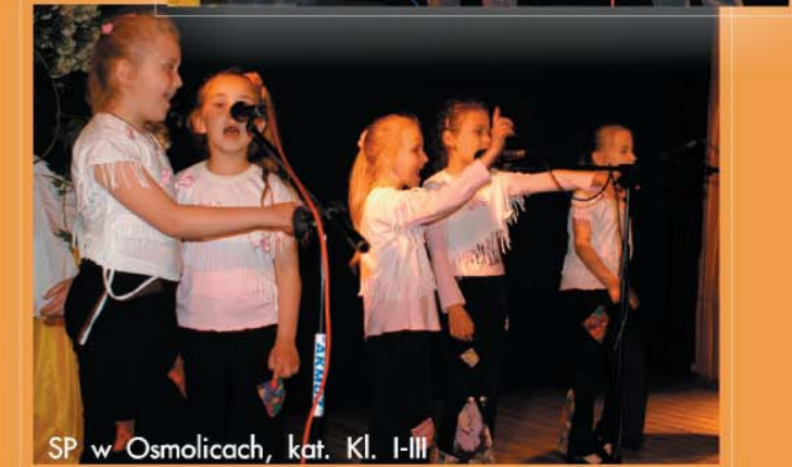
SP w Osmolicach, kat. Kl. I-III