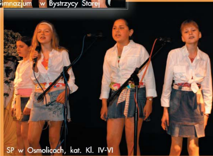
SP w Osmolicach, kat. Kl. IV-VI