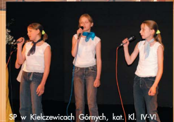
SP w Kielczewicach Górnych, kat. Kl. IV-VI