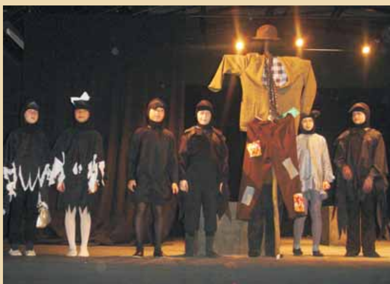
Teatr „X-latka”, w przedstawieniu „Opowieść o strachu na wróble i jego przygodach”, wyreżyserowanym przez Joannę Kawatek.