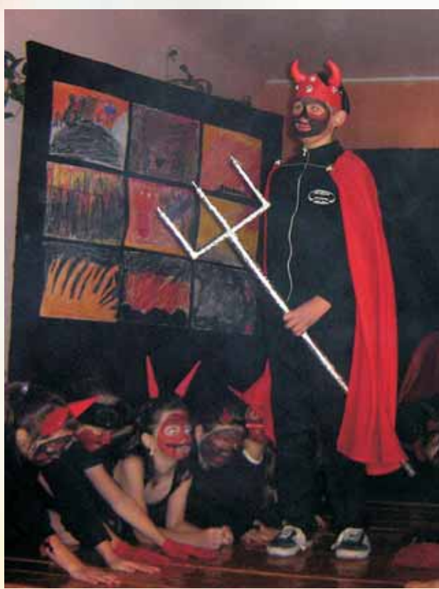
▲ The Legend of Osmolice - przedstawienie teatralne w wykonaniu małych aktorów ze SP w Osmolicach czytaj na str. 5