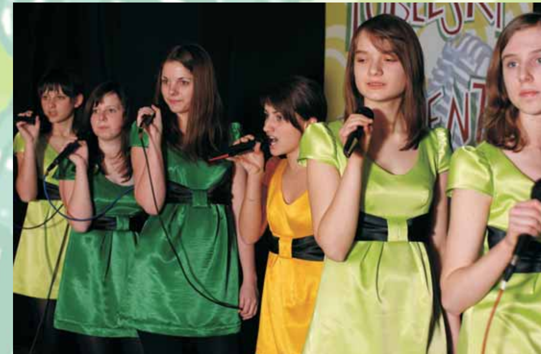
Zespół wokalny "Kropeczki" CKiP Piotrowice - I m w kategorii Zespoły