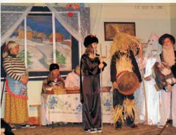
Kolo teatralne ze SP w Rechcie w przedstawieniu pt.: "ZAPUSTY" czytaj na str.6