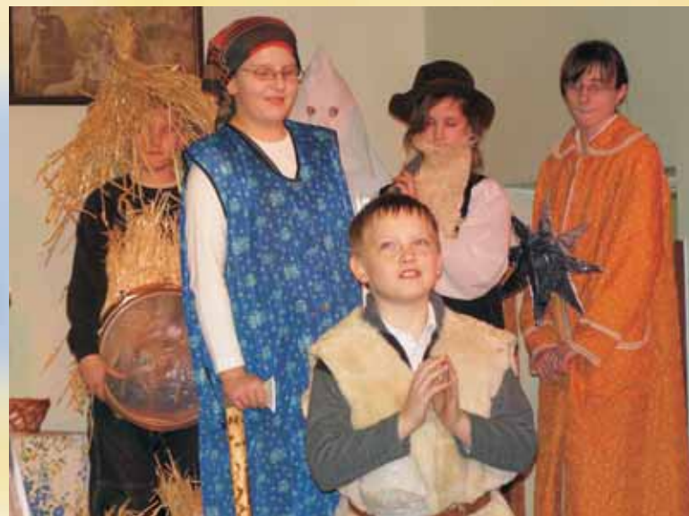
Kolo teatralne ze SP w Rechcie w przedstawieniu pt.: "ZAPUSTY" czytaj na str.6