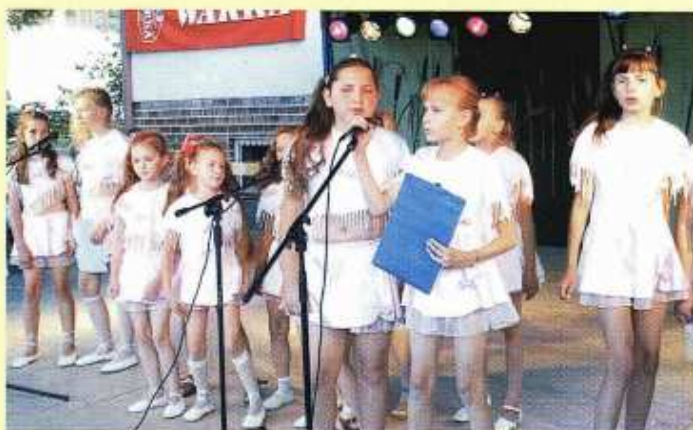
Zespół wokalny - taneczny Wiercipięty - ze Szkoły Podstawowej w Osmolicach