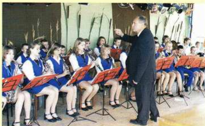
Koncert Gminnej Młodzieżowej Orkiestry Dętej ze Szkoły Podstawowej w Kielczewicach Górnych