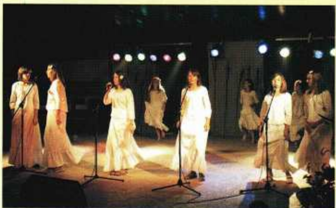
Zespół Wokalny Centrum Kultury i Promocji w Piotrowicach w programie piosenek biesiadnych