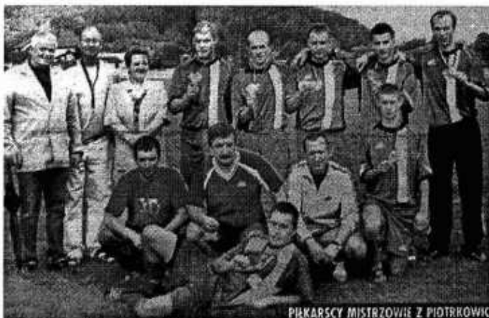
Mistrzowska drużyna piłki nożnej z Piotrowic

Reprezentacja Województwa Lubelskiego zakończyła Igrzyska na ósmej pozycji, do tak wysokiego miejsca w dużym stopniu przyczynili się sportowcy z naszej gminy. Gratulujemy.