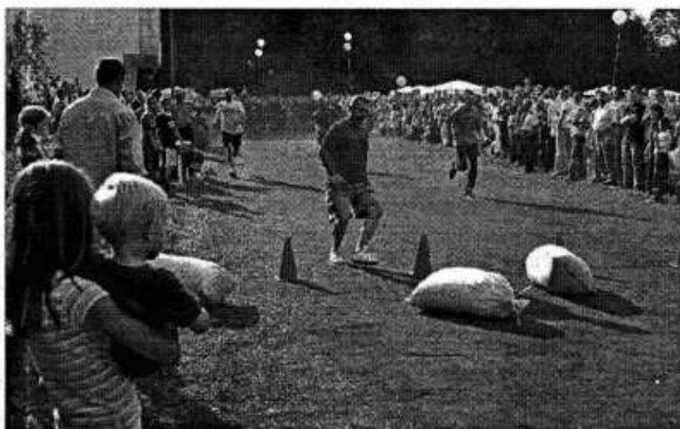
/B.G/ Reprezentanci sołectw w jednej z konkurencji: „Bieg z workiem zboża”