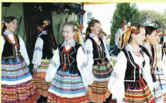
Zespół Pieśni i Tańca Bystrzyca z zespołu Szkół w Bystrzyicy Starej