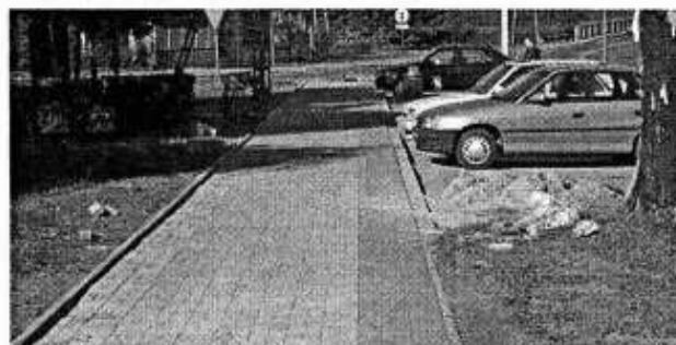
Nowy chodnik w Strzyżewicach