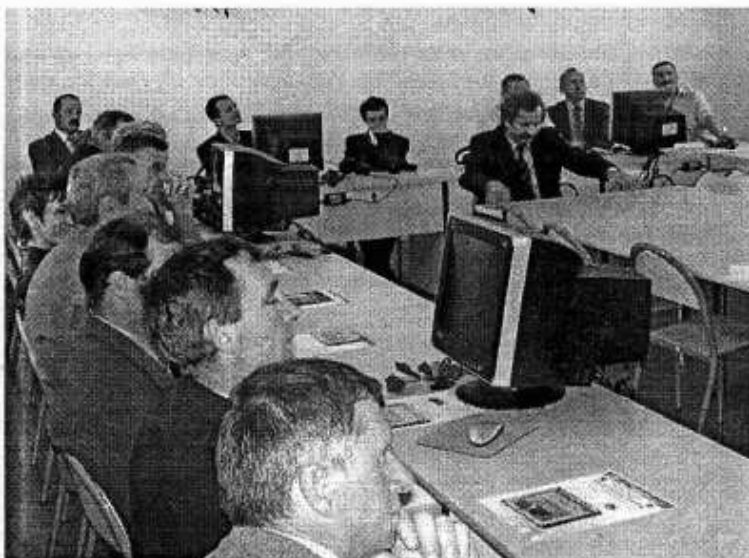
Dyrekcja Zespołu Szkół w Bystrzycy Starej oraz zaproszeni goście w nowej sali multimedialnej