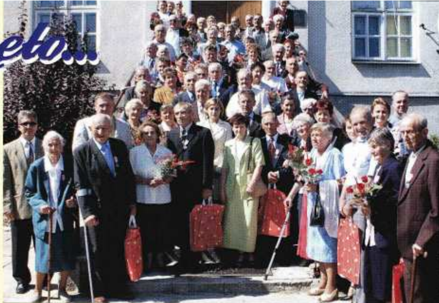
Małżonkowie z 50 letnim stażem małżeńskim w zbiorowej fotografii wspólnie z władzami Gminy