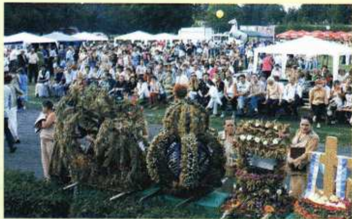
Wieńce dożynkowe złożone przy ołtarzu w podzięk za tegoroczne plony