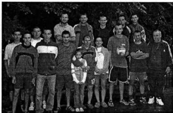
Uczestnicy turnieju plażowej piłki siatkowej