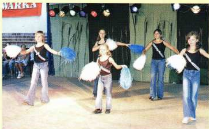
Dziewczeta ze Szkoły Podstawowej w Żabiej Woli w układzie tanecznym