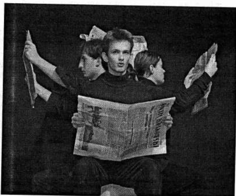
Sztuka pt.: „Gaz” w wykonaniu aktorów z Teatru „Puk - Puk” z MDK w Świdniku