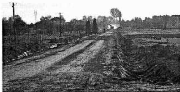
Budowa drogi gminnej w Żabiej Woli