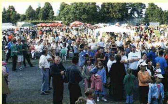
Licznie zgromadzona publiczność Gminnego Święta Plonów