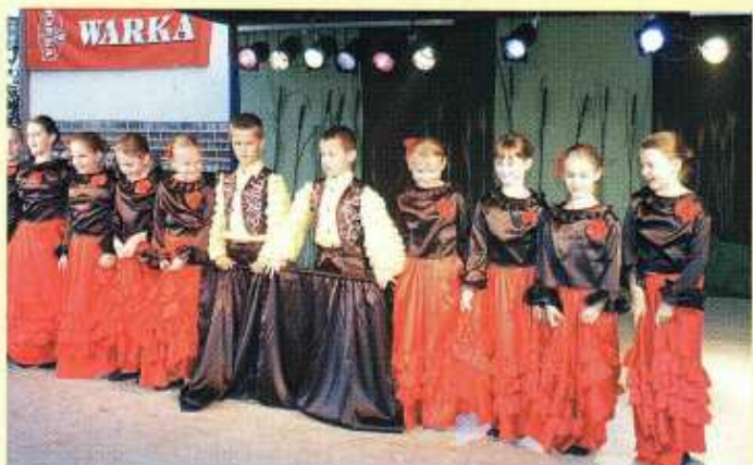
Grupa taneczna Pompon ze Szkoły Podstawowej w Rechcie