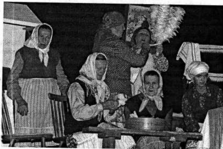
Gospodynie z Paszenek w Obrzędzie pt.: „Pieczenie korowala”