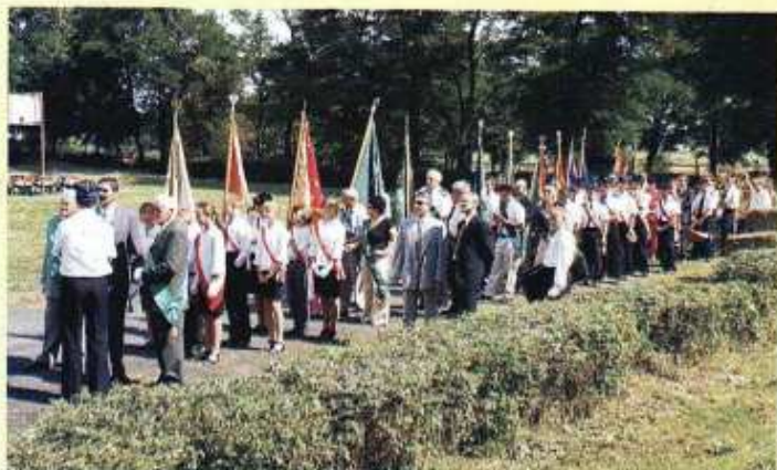
Korowód dożynekowy przygotowujący się do przemarszu w pobliżu ołtarza