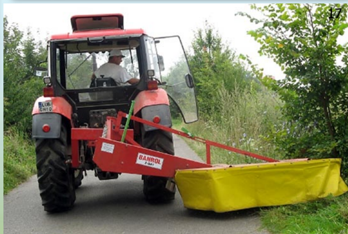
17. Zakup kosiarki rotacyjnej bębnowej z napędem głównym o szerokości roboczej 1,85 m, która służyć będzie grupie porządkowej Urzędu Gminy do koszenia poboczy dróg gminnych. Koszt zakupu: 4 000 zł. Źródło finansowania: budżet gminy.