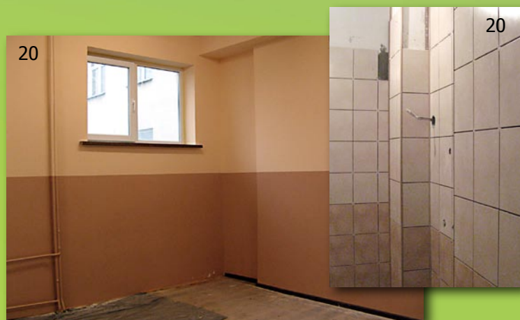
20. Remont w Publicznej Szkole Podstawowej w Rechcie ciągle trwa. Przebudowywane są toalety oraz sala lekcyjna.