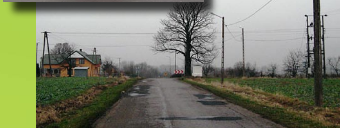
19. Oświetlenie uliczne w miejscowości Kielczewice Pierwsze (24 lampy) i Borkowiznie (24 lampy), łączny koszt oświetlenia : 92 000,00 zł , sfinansowano ze środków budżetu gminy.