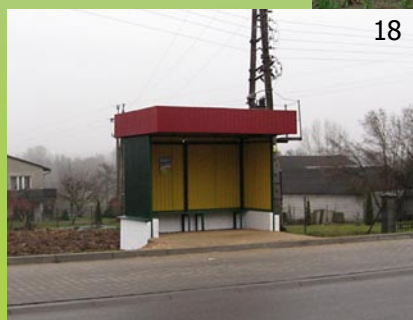
18. Przystanek autobusowy: w Bystrzycy Nowej sfinansowany z budżetu gminy- koszt: 5 999,96 zł