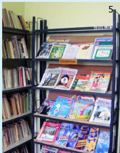
5. W Publicznej Szkole Podstawowej w Osmolicach Pierwszych wykonano remont biblioteki szkolnej, dwóch sal lekcyjnych oraz dwóch łazienek - koszt 50 000, 00 zł