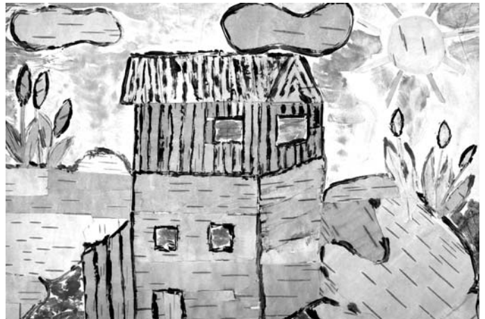
Wyróżnienie- „Barwy przyrody” - wyk. Aleksandra Stępień, kl. III; SP w Rechcie

Na konkurs wpłynęły 4 prace. Jury dokonało oceny wszystkich prac i przyznało następujące nagrody i wyróżnienia: