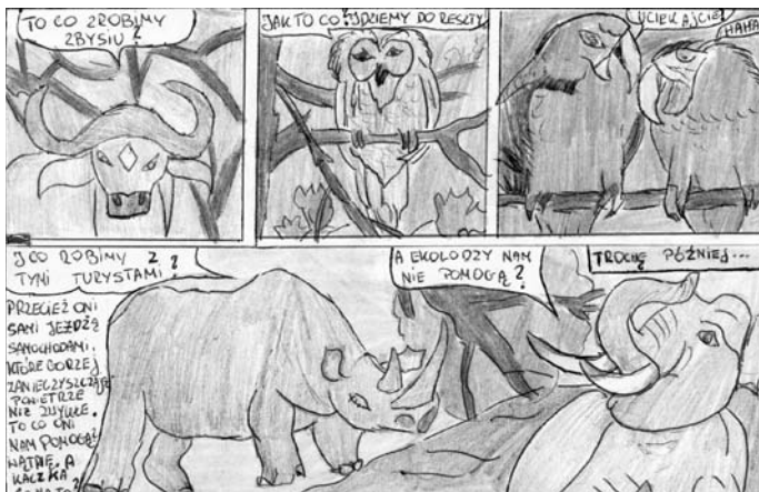
Nagroda za komiks, wyk. Tomasz Wrzesień, kl. III - Gimnazjum w Pszczelnej Woli

Konkurs skierowany był do młodzieży gimnazjalnej z terenu Gminy Strzyżewice.