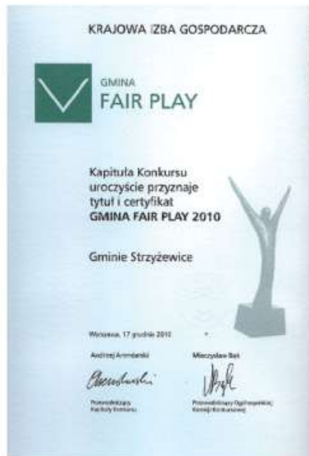
Certyfikat Gmina Fair Play 2010 dla gminy Strzyżewice

Konkurs trwał cały rok i przebiegał dwuetapowo. W trakcie pierwszego etapu gminy składały na piśmie deklarację przystąpienia do konkursu oraz wypełniały ankietę konkursową. Drugi zaś etap polegał na wizytacjach audytorów, którzy sprawdzali wiarygodność informacji zawartych w ankietach konkursowych. Suma ocen przyznanych w drugim etapie (minimalnie 72 na 100 możliwych punktów) decydowała o przyznaniu gminie tytułu, godła i Certyfikatu „Gmina Fair Play”.