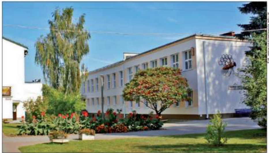
ZSR CKP w Pszczelej Woli

„Rzeczpospolita” i „Perspektywy” już po raz 13. przeprowadziły ranking szkół ponadgimnazjalnych. W tegorocznej edycji konkursu oprócz stałego kryterium oceny, jakim były sukcesy w olimpiadach (mając na uwadze liczbę finalistów i laureatów), uwzględniono także wyniki z matur zarówno z przedmiotów obowiązkowych, jak i z dodatkowych oraz opinię o szkole nauczycieli akademickich. Po raz pierwszy zdecydowano się także na osobną ocenę liceów i techników. Nowo przyjęte kryteria oceny spowodowały, że ranking stał się otwarty na wszystkie szkoły ponadgimnazjalne, pozwoliły też na lepszą prezentację techników, gdzie oprócz przedmiotów matural-