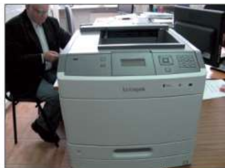
Nowy sprzęt komputerowy w UG Strzyżewice