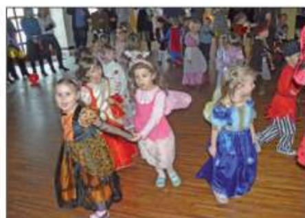
Każde z dzieci mogło się przebrać za ulubioną postać

Każdego roku w naszym przedszkolu organizowany jest karnawałowy bal przebierańców. W tym roku przedszkolaki bawiły się w wyjątkowym miejscu, w sali balowej Dworku Arkadia w Piotrowicach. Dzieci na ten dzień czekały od wielu dni, z przejęciem opowiadały o przygotowanych specjalnie na tą okazję kreacjach