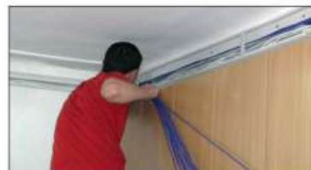
W Urzędzie trwają prace instalatorskie

Równocześnie trwają roboty polegające na przystosowaniu jedne-