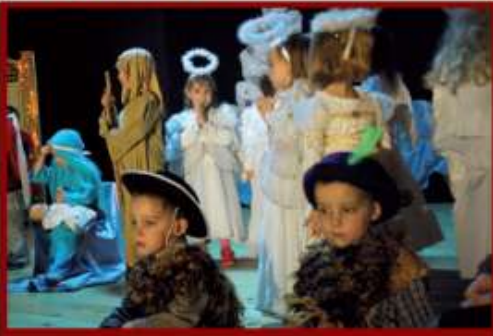
Grupa dzieci młodszych z Samorządowego Przedszkola Publicznego w Piotrowicach