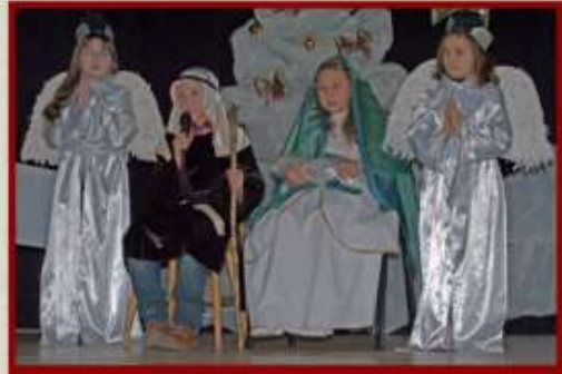
Grupa Kołędnicza ze Szkoły Podstawowej w Kielczewicach Górnych