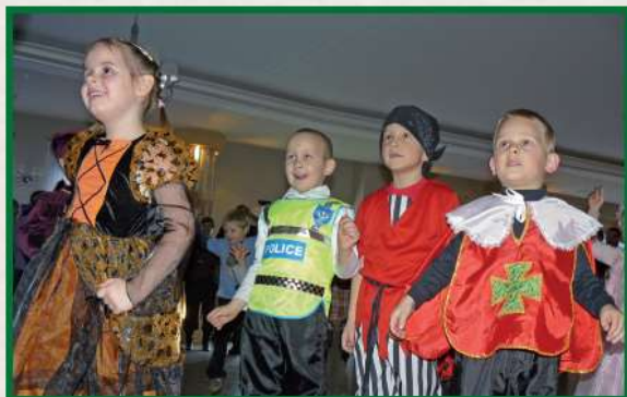
Bal Przedszkolaków z Piotrowic