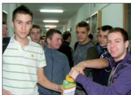
Uczniowie ZSTR w Piotrowicach podczas zbiórki pieniędzy