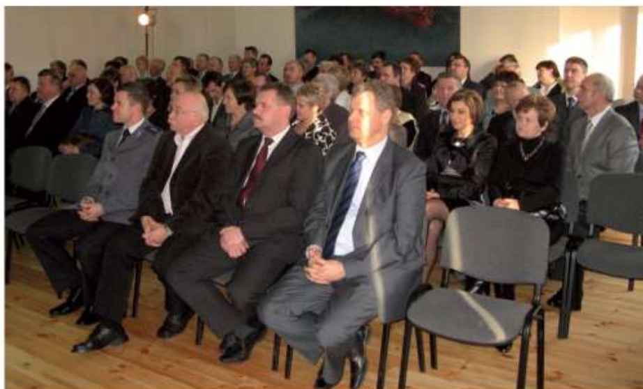
Goście przybyli na Spotkanie Noworoczne

Kulminacyjnym punktem programu było zaproszenie zebranych gości do dworku Kajetana Koźmiana, gdzie odbyło się oficjalne otwarcie zmodernizowanego obiektu.