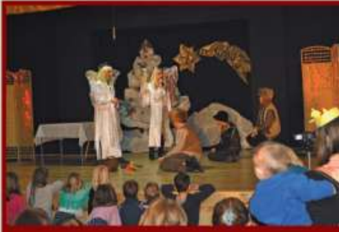
Jasełka ze Szkoły Podstawowej w Rechcie