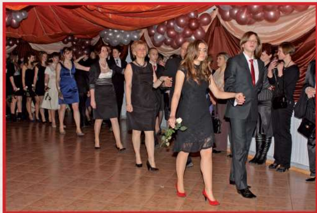
Bal Gimnazjalny w ZSP w Bystrzycy Starej