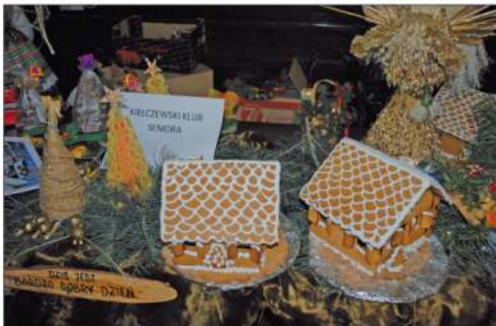
Dekoracje wykonane przez Panie z Kielczewskiego Klubu Seniora