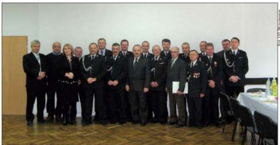
Uczestnicy noworocznego posiedzenia OSP