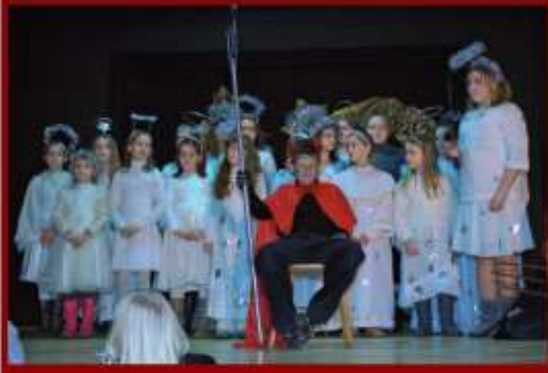
Grupa Kołędnicza ze Szkoły Podstawowej w Osmolicach Pierwszych