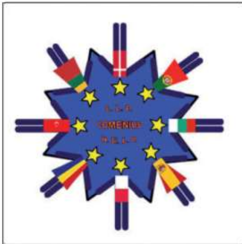
Zwycięskie logo zespołu Comeniusa z Bystrzycy Starej