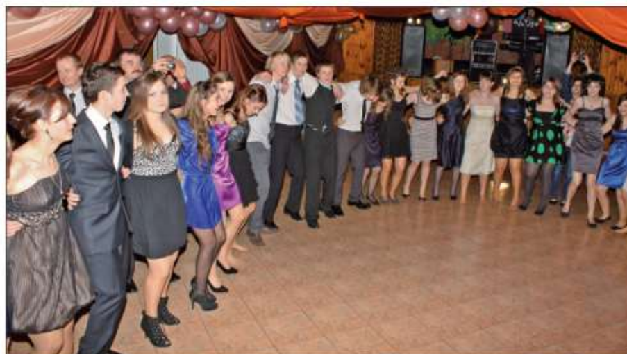
Gimnazjaliści bawili się wylmieniemie na swoim balu