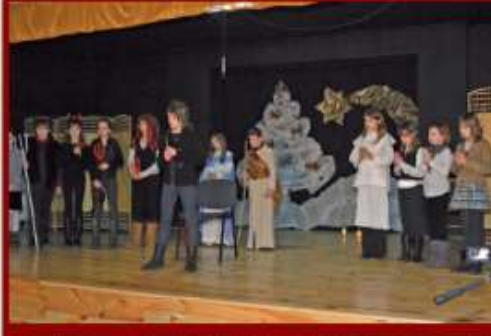
Jasełka w wykonaniu dzieci ze Szkoły Podstawowej w Żabiej Woli