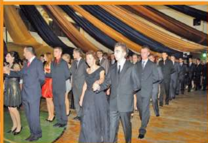
Studniówka w ZSR CKP w Pszczelej Woli