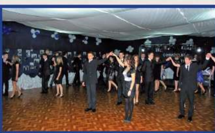
Bal Gimnazjalny w ZSR CKP w Pszczelej Woli