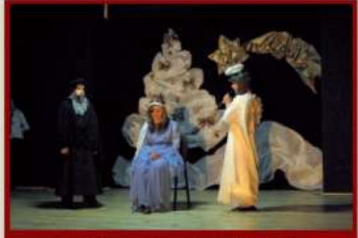
Jasełka w wykonaniu uczniów ZSP w Bystrzycy Starej