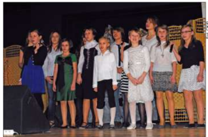
Kolędy i pastoralki w wykonaniu dzieci i młodzieży z CKiP w Piotrowicach