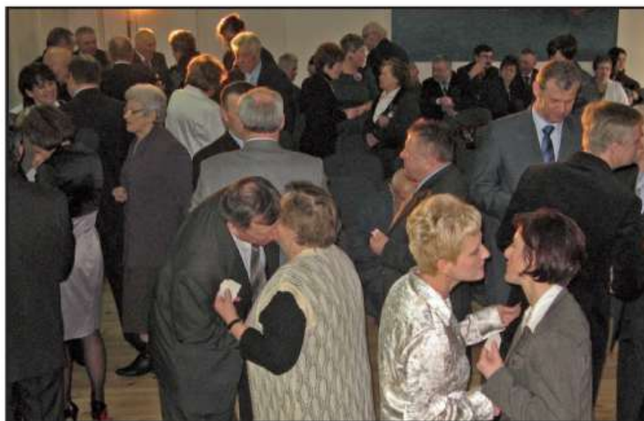
Po wspólnym odśpiewaniu kolędy wszyscy zebrani złożyli sobie noworoczne życzenia

Remont trwał od września 2009r. i zakończył się niemalże rok później. W dworku wymieniono wszystkie instalacje, położono nowe podłogi, dach, wymieniono okna, odgrzybiono cały budynek i odnowiono elewacje. Wszystkie prace były konsultowane z konserwatorem zabytków. Uporządkowano również otoczenie wokół obiektu wycinając stare, chore drzewa, obsiewając trawniki i sadząc byliny. W ostatnim czasie trwało urządzenie wnętrza dworku w ramach projektu pn. „Zakup wyposażenia do dworku w Piotrowicach na potrzeby Centrum Kultury i Promocji Gminy Strzyżewice”. W budynku powstały m.in. planowane sale wystawowe i warsztatowe dla Centrum Kultury, Gminny Punkt Informacji Turystycznej, czy Izba Pamięci poświęcona dawnemu właścicielowi obiektu - Kajetanowi Koźmianowi – poecie i pamiętnikarzowi, dzięki któremu dworek w Piotrowicach zyskał sławę. Wyposażenie budynku, które kosztowało 226 080,85zł było możliwe dzięki dofinansowaniu z Programu Rozwoju Obszarów Wiejskich w kwocie 138 984,00zł.