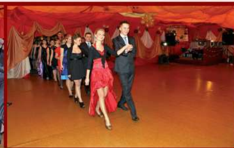
Studniówka w ZSTR w Piotrowicach