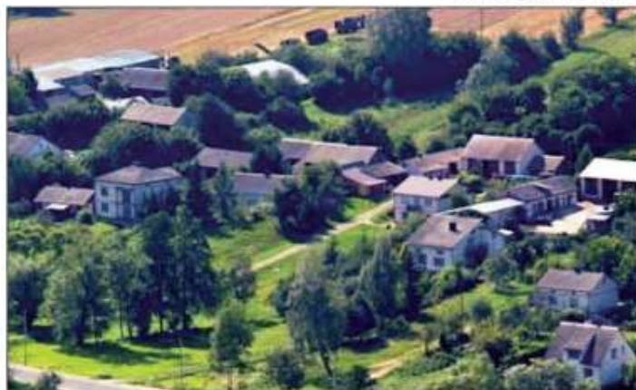
Azbest - realne zagrożenie