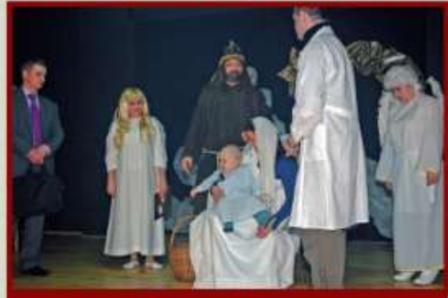
Rodzice Przedszkolaków w widowisku wyreżyserowanym przez Martę Baran