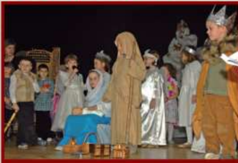
Grupa starszaków z Przedszkola w Piotrowicach