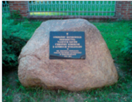
Płyta pamiątkowa z okazji jubileuszu 580 – lecia parafii.

Szczególne podziękowania trzeba skierować do tych naszych parafian, którzy w myśl słów ewangelii „Nie mam srebra ani złota, ale co mam, to Ci daję” złożyli datki pieniężne na