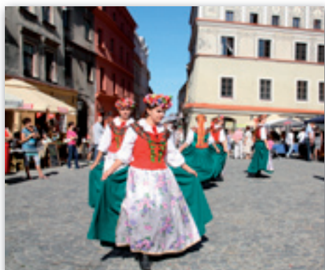
Zespół pieśni i tańca APIS podczas Święta Miodu w Lublinie

Koniec lata to czas świętowania plonów. W wojewódzkich i gminnych dożynkach corocznie bierze udział także Zespół Szkół Rolniczych z Pszczeliej Woli. W tym roku 28 sierpnia uczestniczyliśmy w obchodach Wojewódzkiego Święta Plonów w Radawcu, a 4 września wzięliśmy udział w Gminnym Święcie Plonów w Strzyżewicach oraz Święcie Miodu w Lublinie. Imprezy uświetnił Zespół Pieśni i Tańca Apis, którego występ cieszył się dużym uznaniem widzów.