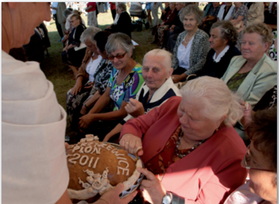
Tradycyjne dzielenie chleba upieczonego z mąki pochodzącej z tegorocznych zbiorów

Podziękowania za wsparcie finansowe imprezy kierowane są także do sponsorów: