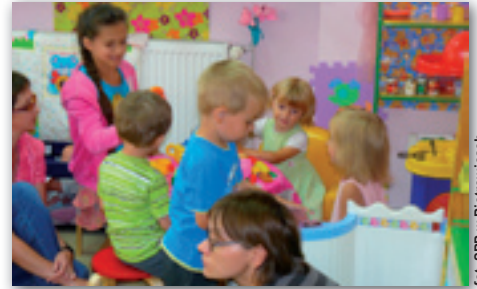
fol. SPP w Piotrowicach