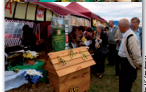
Zwycięskie stoisko Gminy Strzyżewice