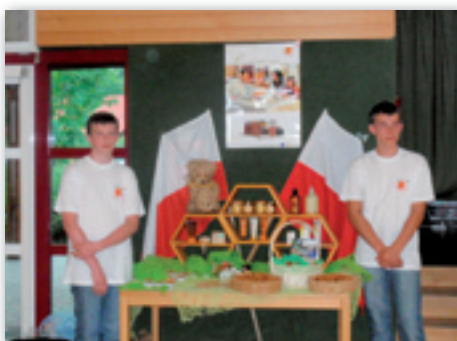
Prezentacja tradycji poszczególnych państw

Po podsumowaniu wyników dwudniowych zmaganiach okazało się, że tegorocznymi zwycięzcami zostali gospodarze – Austriacy. Nasi chłopcy uplasowali się w złotym środku, czyli na 8. miejscu.