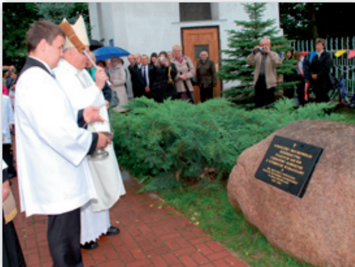
Poświęcenie tablicy pamiątkowej

kościół, poświęcali swój wolny czas, swoje siły, przychodząc do pracy przy porządkach, dekoracji czy innych niezbędnych pracach. Bez nich, bez ich zaangażowania nie było by uroczystości jubileuszowej.