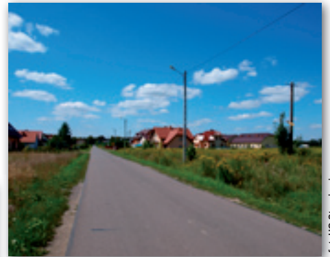
Nowe oświetlenie przy drodze gminnej

dzy lipami ustawiono ławki parkowe w ilości 20 szt., na których można usiąść i delektować się widokiem naszej pięknej alei.