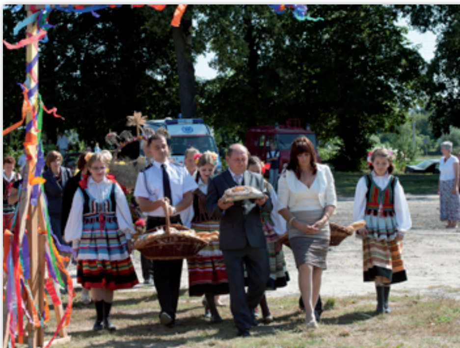
Przemarsz korowodu prowadzonego przez Starostów tegorocznych dożynek