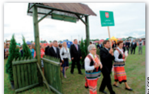
Delegacja z Gminy Strzyżewice w przemarszu korowodu wieńcowego