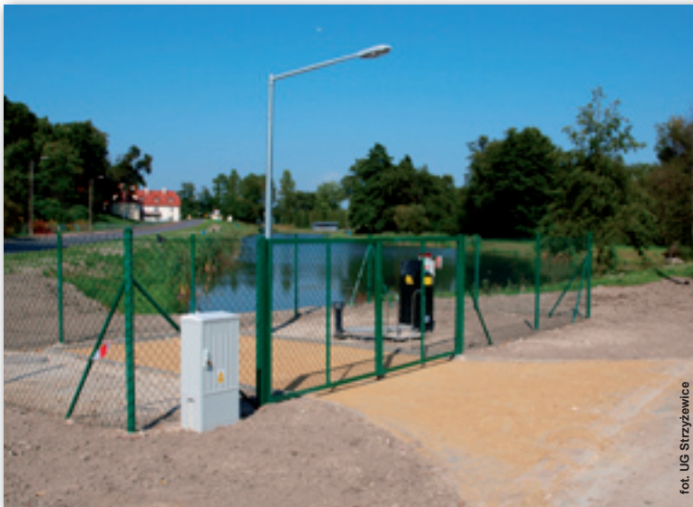
Nowa przepompownia ścieków w Piotrowicach