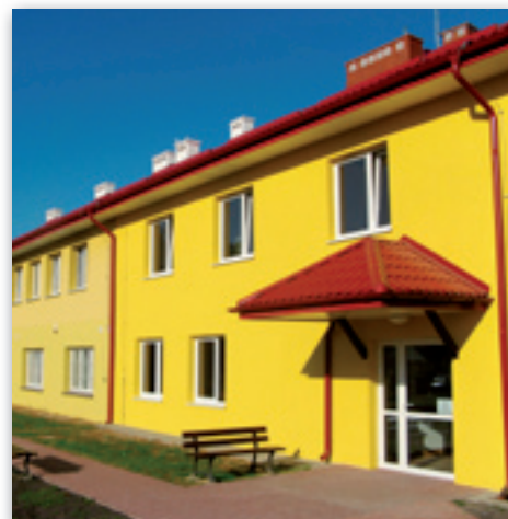
Nowe wejście do budynku Urzędu Gminy

Zmienia się także otoczenie wokół budynku – usunięto część drzew, ułożone zostały chodniki, częściowo wymieniono ogrodzenie i ustawiono ławki.