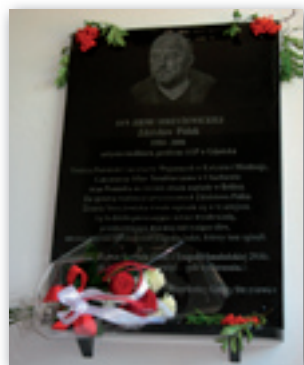
Tablica pamiątkowa poświęcona pamięci Zdzisława Pidka

Zdzisław Pidek był znanym architektem, artystą rzeźbiarzem i profesorem Akademii Sztuk Pięknych w Gdańsku. Urodził się 16 maja 1954r. w Bychawie. Dzieciństwo spędził w Rechcie, gdzie uczęszczał do Szkoły Podstawowej. Po ukończeniu szkoły kontynuował naukę w Państwowym Liceum Sztuk Plastycznych w Nałęczowie. Potem wyjechał do Gdańska, gdzie w latach 1974-1979 studiował na Wydziale Rzeźby. Postanowieniem Prezydenta Rzeczypospolitej Polskiej dnia 20 sierpnia 2001 r. otrzymał tytuł naukowy profesora.