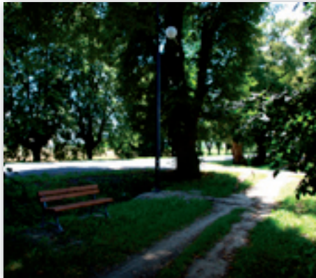
Zabytkową Aleją Rohlandów można teraz spacerować również wieczorami

W ramach zadania wykonano oświetlenie wzdłuż drogi gminnej nr 107125L i dróg powiatowych nr 2277L oraz 2269L w Żabiej Woli oraz oświetlona została Aleja Rohlandów. Pomie-