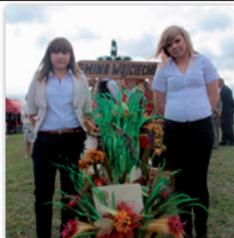
Delegacja z ZSR CKP na Dożynkach Wojewódzkich w Radawcu