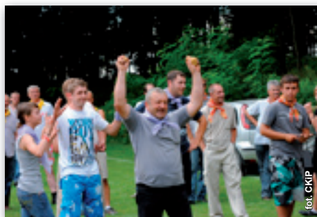
Zwycięska drużyna z Osmolic Pierwszych

Kawałek - dbał o przeprowadzenie konkurencji zgodnie z regulaminem. Wszystkie drużyny bardzo starały się uzyskać jak najwięcej punktów. I tak dla przykładu: najszybciej pianę biją panowie w Osmolicach Pierwszych, najbardziej głodny był