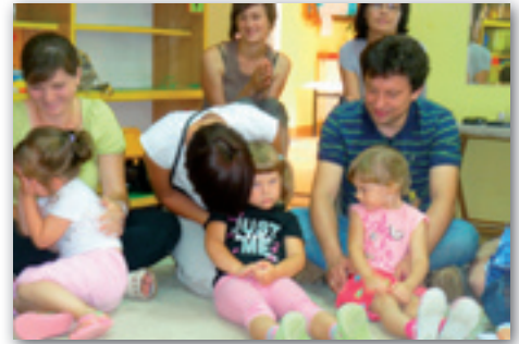
Zajęcia adaptacyjne pomagają dzieciom zaaklimatyzować się w przedszkolu

/Samorządowe Przedszkole Publiczne w Piotrowicach/