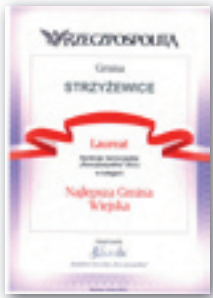
Dyplom dla Gminy Strzyżewice

Po raz 13. w redakcji dziennika „Rzeczpospolita” w Warszawie wręczono wyróżnienia przyznawane w Rankingu Samorządów Rzeczpospolitej.