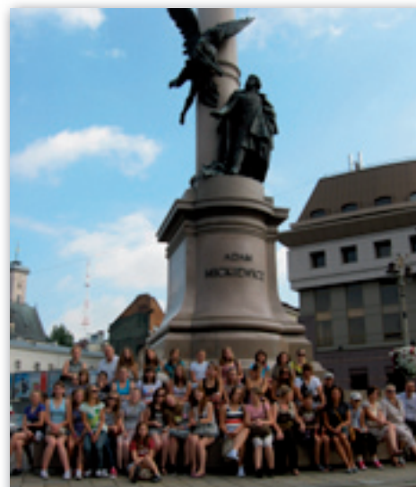
Pamiętkowe zdjęcie pod pomnikiem A. Mickiewicza

Po czterech dniach spędzonych w domach ukraińskich rodzin, dzieciom żal było się rozstawać, płynęły łzy i słowa szczerych,