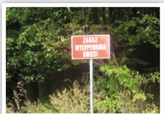
Tablica ustawiona w miejscu likwidacji dzikiego wysypiska śmieci

Gmina Strzyżewice przy wsparciu Wojewódzkiego Funduszu Ochrony Środowiska i Gospodarki Wodnej w Lublinie realizowała w 2016 roku inwestycje o charakterze proekologicznym. Miały one na celu likwidację dzikich wysypisk,