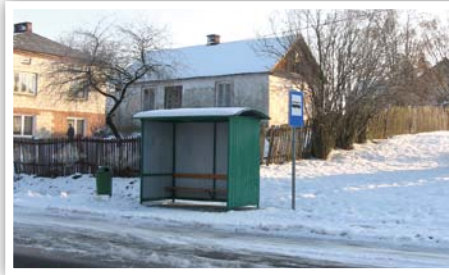
Wiata przystankowa w Kielczewicach Górnych

Budowa chodnika, zjazdów i zatoki autobusowej w miejscowościach Strzyżewice od km 19+638 do km 20+340 oraz Bystrzyca Nowa od km 17+690 do km 18+110 w ciągu drogi wojewódzkiej Nr 834 Bełżyce - Niedzwica Duża - Bychawa - Stara Wieś III, (720 m w Strzyżewicach i 420 m w Bystrzycy Nowej) koszt zadania: 617 830,83 zł, źródła finansowania: Województwo Lubelskie: 247 132,33 zł, Gmina Strzyżewice 370 698,50 zł.