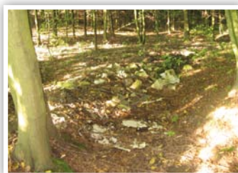
Dzikie wysypisko w miejscowości Piotrowice

Gmina Strzyżewice przy wsparciu Wojewódzkiego Funduszu Ochrony Środowiska i Gospodarki Wodnej w Lublinie realizowała w 2016 roku inwestycje o charakterze proekologicznym. Miały one na celu likwidację dzikich wysypisk,