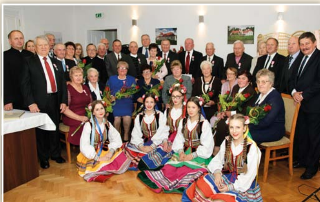
Szanowni Jubilaci oraz goście