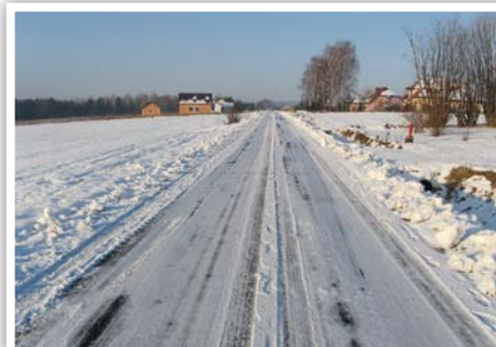
Modernizacja drogi gminnej nr 112524L w Osmolicach Pierwszych

Modernizacja drogi gminnej na 112524L (działka nr ewid. 1006) na odcinku od km 0+712 do km 1+104 w miejscowości Osmolice Pierwsze, gm. Strzyżewice (odcinek 392 m), koszt zadania: 219 382,97 zł, źródła finansowania: budżet Gminy Strzyżewice: 169 382,97 zł, Fundusz Ochrony Gruntów Rolnych: 50 000,00 zł.