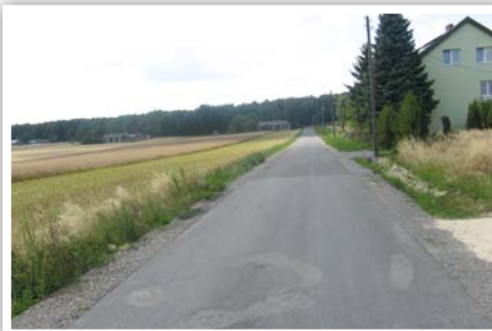
Droga gminna nr 107139L w Kolonii Kielczewice Dolne

Budowa drogi gminnej nr 107139L w Kolonii Kielczewice Dolne na odcinku 400 m, koszt zadania: 144 078,86 zł, źródło finansowania budżet Gminy Strzyżewice.