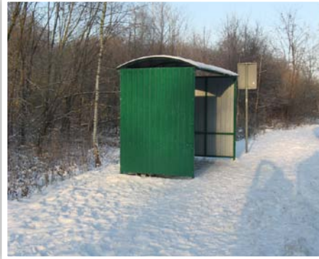
Wiata przystankowa przy PSP w Kielczewicach Górnych