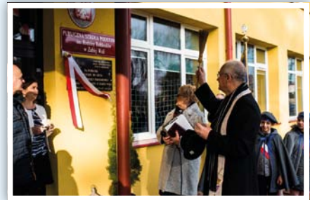
Poświęcenie pamiątkowej tablicy w budynku szkoły