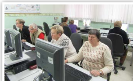
Dla Małego, czy dużego - dla każdego!