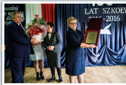
Gratulacje od Wójta Gminy Strzyżewice

Podczas Mszy Świętej szkoła została odznaczona przez wojewodę Dyplomem Uznania z medalem wojewody lubelskiego.