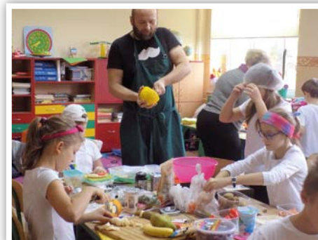
Osmolice - Moc Rodziców również jest wielka