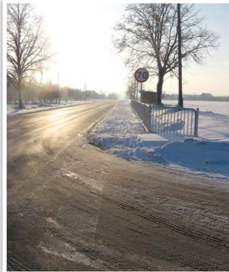
Chodnik przy DW 834 w Bystrzycy Nowej

Budowa chodnika, zjazdów i zatoki autobusowej w miejscowościach Strzyżewice od km 19+638 do km 20+340 oraz Bystrzyca Nowa od km 17+690 do km 18+110 w ciągu drogi wojewódzkiej Nr 834 Bełżyce - Niedzwica Duża - Bychawa - Stara Wieś III, (720 m w Strzyżewicach i 420 m w Bystrzycy Nowej) koszt zadania: 617 830,83 zł, źródła finansowania: Województwo Lubelskie: 247 132,33 zł, Gmina Strzyżewice 370 698,50 zł.