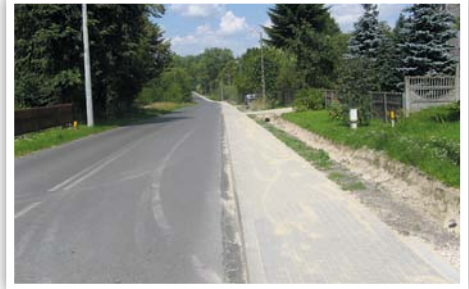
Chodnik przy drodze powiatowej w Kielczewicach Górnych