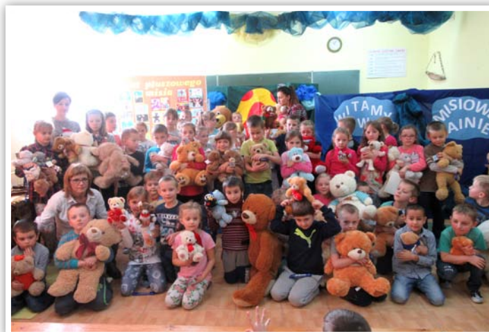
Goście urodzin sympatycznego pluszaka