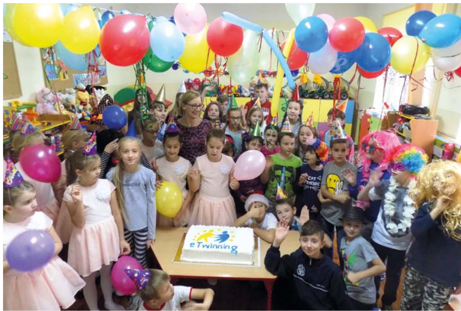
Uczestnicy projektu Step by Step z PSP w Osmolicach i apetyczny tort eTwinning