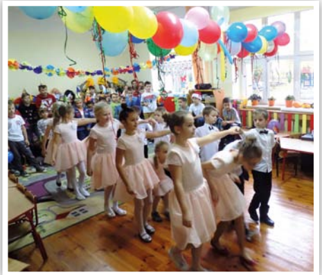
Wspólny taniec

3 listopada 2016 r. uczniowie Publicznej Szkoły Podstawowej w Osmolicach Pierwszych świętowali online wraz ze szkołą partnerską Cbs Het Stroombdal in Zuidlaren przyznaniem nagrody eTwinning 2015/16 w Holandii za najlepszy projekt międzynarodowy w kategorii wiekowej 4-12 lat. Wirtualne spotkanie (live event), zorganizowane na TwinSpace, polskie dzieci rozpoczęły uroczystym polonezem, chcąc zaprezentować swój narodowy taniec. Wszyscy byli