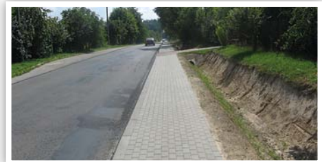
Chodnik przy drodze powiatowej w Osmolicach Pierwszych