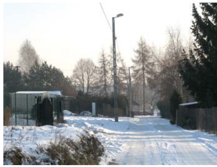
Oświetlenie przy drodze wewnętrznej w Polanówce

Budowa oświetlenia drogi gminnej wewnętrznej w Polanówce na odcinku 570 m (12 punktów świetlnych), koszt zadania: 30 000,00 zł, źródło finansowania: budżet Gminy Strzyżewice.