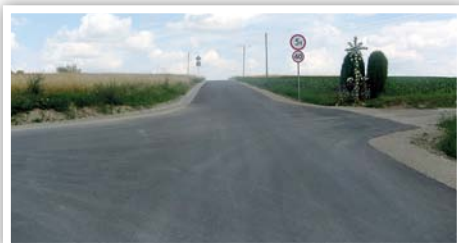
Droga nr 107144L w Kielczewicach Górnych

Przebudowa drogi gminnej nr 107144L w Kielczewicach Górnych na odcinku 263 m, koszt zadania: 102 816,60 zł, źródło finansowania: budżet Gminy Strzyżewice.