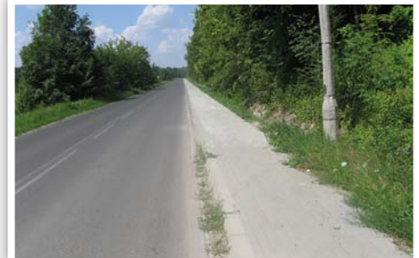
Chodnik przy drodze powiatowej w Kielczewicach Dolnych