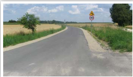
Droga nr 107142L w Kielczewicach Maryjskich

Przebudowa drogi gminnej nr 107142L w Kielczewicach Maryjskich na odcinku 300 m, koszt zadania: 105 101,25 zł, źródło finansowania: budżet Gminy Strzyżewice.