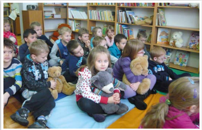
Z Misiem zawsze różniej

klasy IIIB razem z opiekunami. Dzieci przyniosły ze sobą swoje ulubione misie na znak, że są ich przyjaciółmi. W czasie spotkania gimnazjalistki z klasy IIA przedstawiły maluszkom prezentację multimedialną związaną z historią pluszowego misia, recytowały także wiersze o misiach. Mali słuchacze poznali również książki, w których głównym bohaterem jest miś. Kolejnym punktem naszego spotkania były konkursy: na najszybszego zjadacza misiowego przysmaku, czyli miodku, przenoszenie wykałaczek w rękawiczkach kolorowych baloników. Odbył się również konkurs na najmniejszego i największego misia. Spotkanie przebiegało w miłej atmosferze i dostarczyło dzieciom niezastą-