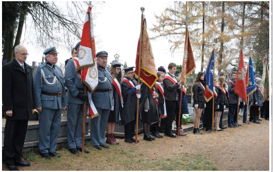
Poczty Sztandarowe