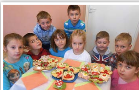
Rechta - Śniadanie daje moc