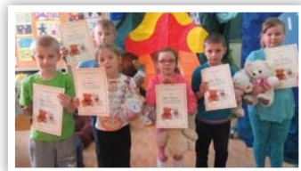
Laureaci szkolnego konkursu grafiki komputerowej

Tradycyjnie, jak co roku, Filia GBP w Kielczewicach Górnych wraz z PSP w Kielczewicach Górnych zorganizowała obchody Światowego Dnia Pluszowego Misia. W tym roku kolejne już urodziny pluszowej maskotki, którą zna chyba każde dziecko, obchodziliśmy 25 listopada. W wypełnionej po brzegi „Misiowej Krainie” bawiło się wspólnie prawie 70 osób. Na początku spotkania przypomnieliśmy sobie historię narodzin pluszowej maskotki. Sprawdzaliśmy jak wiele znamy misiowych bohaterów z bajek. Okazało się, że nie ma dziecka, które nie umiałoby wymienić choćby kilku z nich.