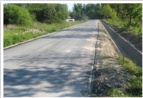
Droga nr 107128L w Piotrowicach

Przebudowa drogi gminnej nr 107128L w Piotrowicach na odcinku 196 m, koszt zadania: 99 805,78 zł, źródło finansowania: budżet Gminy Strzyżewice.