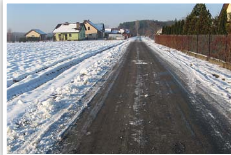
Przebudowa drogi wewnętrznej w Żabiej Woli

Przebudowa drogi gminnej wewnętrznej dz. nr 416 w Żabiej Woli na odcinku 303 m wraz z budową sieci wodociągowej śr. 160 mm, koszt zadania: 162 933,11 zł, źródło finansowania: budżet Gminy Strzyżewice.