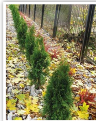
Nasadzenia przy PSP w Strzyżewicach -Rechcie