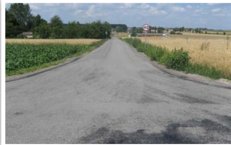
Droga gminna nr 107129L w Kajetanówce

Przebudowa drogi gminnej nr 107129L w Kajetanówce na odcinku 217 m, koszt zadania: 77 426,05 zł, źródło finansowania: budżet Gminy Strzyżewice.