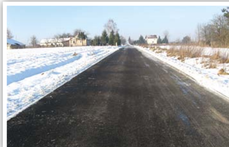
Przebudowa drogi gminnej nr 107121L w Osmolicach Pierwszych

Przebudowa drogi gminnej nr 107121L w Osmolicach Pierwszych w km 0+000 do km 1+455, koszt zadania: 661 667,64 zł, źródła finansowania: Program rozwoju gminnej i powiatowej infrastruktury drogowej na lata 2016-2019: 329 583,00 zł, budżet Gminy Strzyżewice 167 126,64 zł, Powiat Lubelski: 164 958,00 zł.