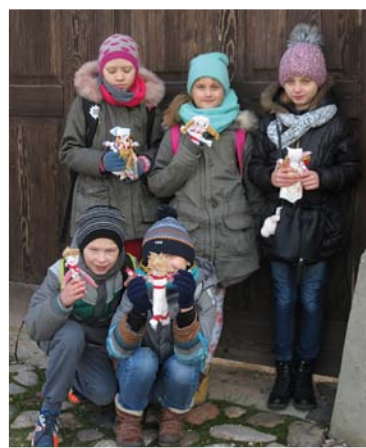
Z własnoręcznie wykonanymi lalkami, fot. K. Tuzimska