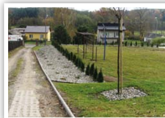
Nasadzenia przy PSP w Strzyżewicach -Rechcie

W ramach zadania przed budynkiem Publicznej Szkoły Podstawowej w Strzyżewicach - Rechcie wykonano prace polegające na przygotowaniu terenu, wykonaniu rabat oraz wykonaniu nasadzeń 142 szt. roślin wieloletnich. Wartość zadania wyniosła 13 000,00 zł. Źródła finansowania to: dotacja z WFOŚiGW w Lublinie - 6 500,00 zł oraz budżet gminy - 6 500,00 zł.