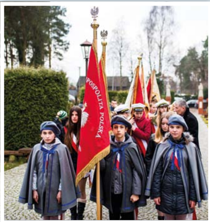
Pocztom sztandarowe zgromadzone na uroczystości

25.11.2016 r. w 100 rocznicę organizacji pierwszych zajęć edukacyjnych na terenie Żabiej Woli Publiczna Szkoła Podstawowa im. Rodziny Rohlandów świętowała Złoty Jubileusz.