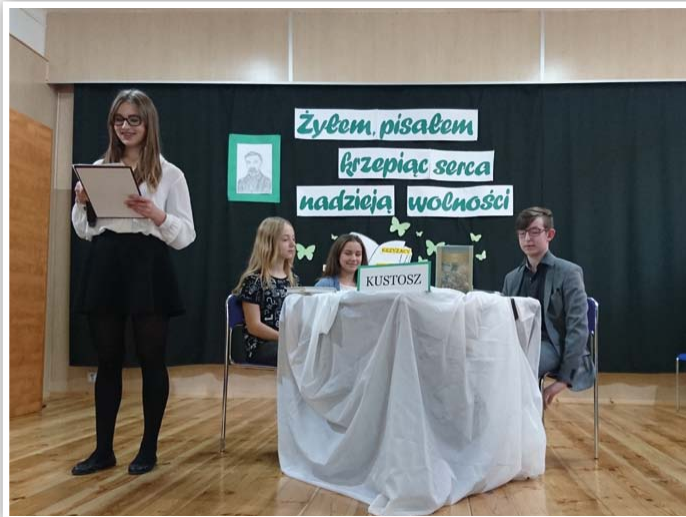
Przenosiny do czasów Sienkiewicza