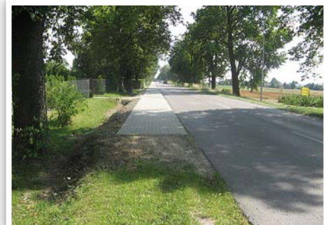
Chodnik przy drodze powiatowej w Żabiej Woli