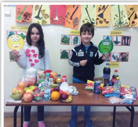
Bystrzyca Stara - Wybieramy to co zdrowe, fot. U. Tomusiak.