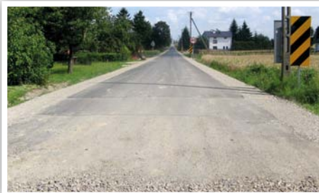
Droga gminna nr 107131L w Bystrzycy Nowej

Przebudowa drogi gminnej nr 107131L w Bystrzycy Nowej na odcinku 400 m, koszt zadania: 157 171,18 zł, źródło finansowania: budżet Gminy Strzyżewice.