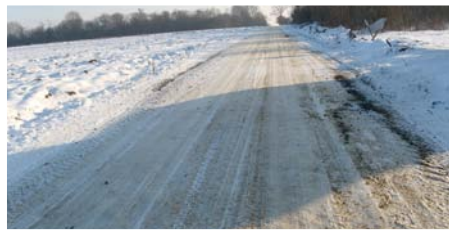
Przebudowa drogi gminnej nr 112486L w Żabiej Woli

Przebudowa drogi gminnej nr 112486L w Żabiej Woli na odcinku od km 0+000 do km 0+084 i od km 0+474 do km 1+000 – odcinek o łącznej długości 610 m, koszt zadania: 502 000,00 zł, źródła finansowania: budżet Gminy Strzyżewice 352 000,00 zł, Gmina Jabłonna: 150 000,00 zł.