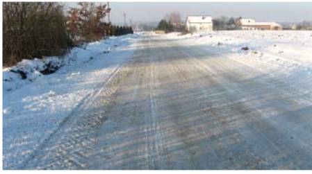
Utwardzenie dna wężowego lessowego w ciągu drogi gminnej nr 112486L w Żabiej Woli

Przebudowa drogi gminnej nr 112486L w Żabiej Woli na odcinku od km 0+000 do km 0+084 i od km 0+474 do km 1+000 – odcinek o łącznej długości 610 m, koszt zadania: 502 000,00 zł, źródła finansowania: budżet Gminy Strzyżewice 352 000,00 zł, Gmina Jabłonna: 150 000,00 zł.