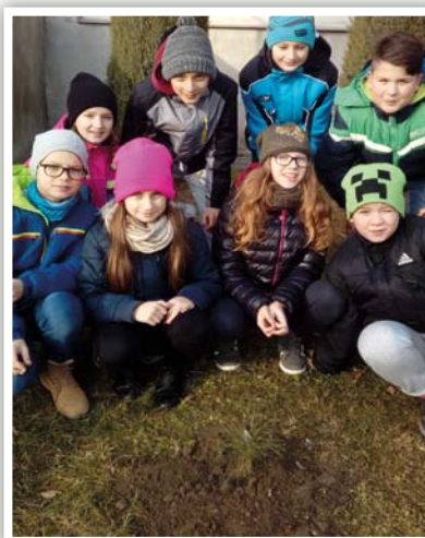
Drzewko zasadzone