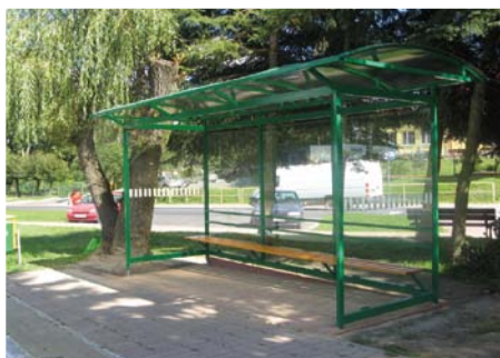
Przystanek autobusowy w Strzyżewicach (zajezdnia autobusowa) - 2014 r.

Inwestycje realizowane przez Województwo Lubelskie przy udziale finansowym Gminy Strzyżewice.