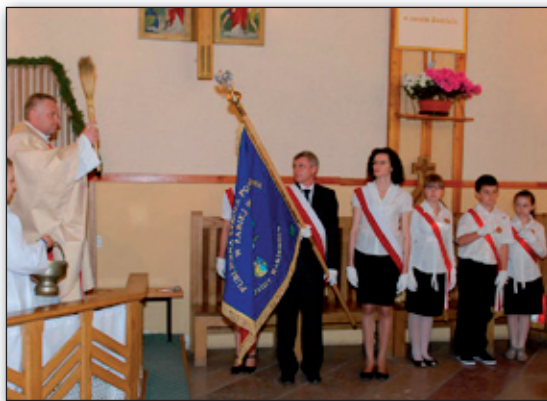
Poświęcenie nowego sztandaru szkoły w Żabiej Woli.