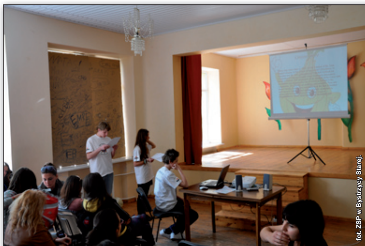
Prezentacja polskiego warzywa.