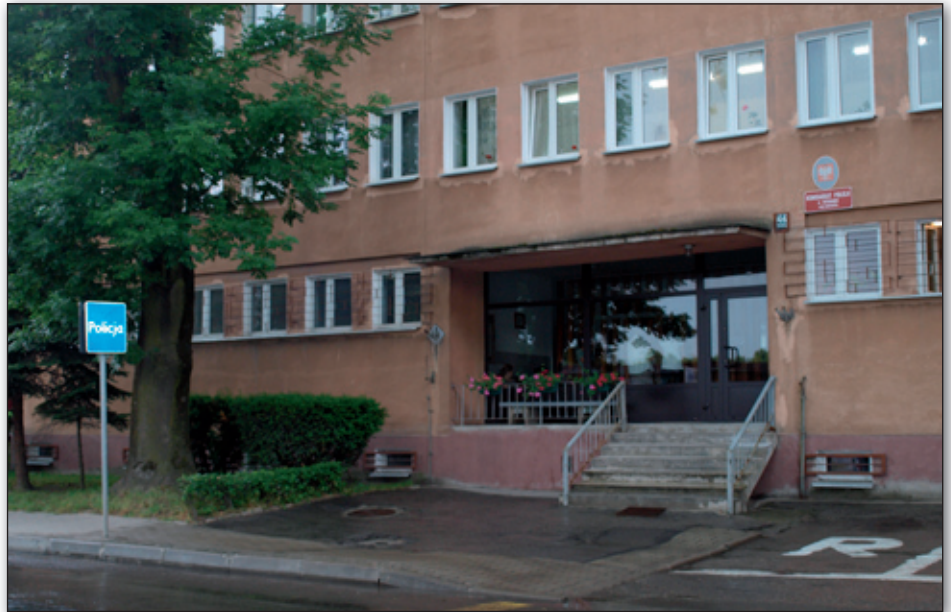
Komisariat Policji w Bychawie na ul. Piłsudskiego 44.

bez opieki i uczyć je, aby nie rozmawiały z obcymi osobami i nie podawały swoich danych. W takich sytuacjach, jeśli zauważycie Państwo jakieś podejrzané zachowanie osób, obce pojazdy, proszę nas niezwłocznie o tym powiadać, żebyśmy mogli zapobiec ewentualnym zagrożeniom. Okres letni charakteryzuje się też wzrostem wypadków w gospodarstwach rolnych. Rodzice muszą dopilnować tego, aby dzieci, podczas pomagania im w pracach polowych robiły to rozsądnie - nie prowadziły maszyn rolniczych i nie były przewożone na tych maszynach w niewłaściwy sposób, jak też nie przebywały na wysokościach, gdyż grozi to upadkami wynikającymi głównie z braku dbałości o porządek w obrębie danego gospodarstwa, tj.: brakiem prawidłowego zabezpieczenia studzienek, zbiorników, otworów do zrzucania słomy, czy siana. Jako dzielnicowy mam także prośbę do mieszkańców o właściwe zabezpieczenie mienia na działkach, czy placach budowy oraz nie pozostawiania i zabierania ze sobą do domu wartościowych rzeczy, typu kosiarki, kosy spalinowe, rowery, sprzęty budowlane. Przypominam również obywatelom o obowiązku właściwego przetrzymywania psów, by nie biegały one wolno poza posesją i nie stanowiły zagrożenia szczególnie dla dzieci. Kolejną moją prośbą do mieszkańców jest oznaczanie numerami porządkowymi posesji, poprzez umieszczenie tabliczki z numerem w widocznym miejscu. Ułatwia to znacznie pracę nie tylko policji, ale też innych służb ratowniczych - pogotowia ratunkowego i straży pożarnej. Mogą one bez