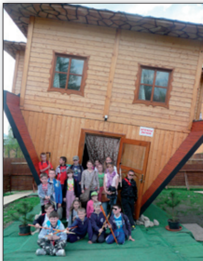
Dzieci na „Zielonej szkole” w Zakopanem.