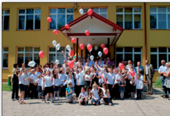
Święto Patrona będzie corocznie obchodzone w PSP w Żabiej Woli.