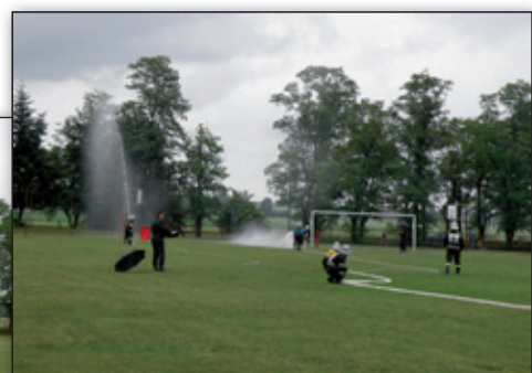
Najlepsze drużyny Gminy Strzyżewice na zawodach powiatowych w Pszczelnej Woli: kobieca z OSP Żabia Wola (w czerwonych dresach) i męska z OSP Dębszczyzna.