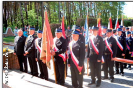
Jednostki OSP z terenu gminy zebrały się w tym dniu w kościele pod wezwaniem Matki Boskiej Częstochowskiej w Żabiej Woli.

Mszę świętą w intencji strażaków zakończono poświęceniem samochodu bojowego oraz figurki św. Floriana i nowo wybudowanej kapliczki w Pszczelnej Woli, którą drухowie z jednostki OSP Żabia Wola wykonali samodzielnie. Po wystąpieniach gości oraz prezesa OSP Żabia Wola wszyscy zgromadzeni udali się na