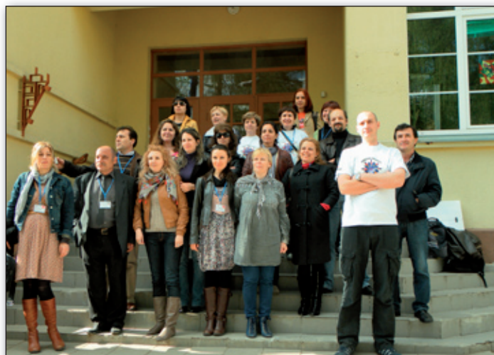
Zespół nauczycielski projektu H.E.L.P.