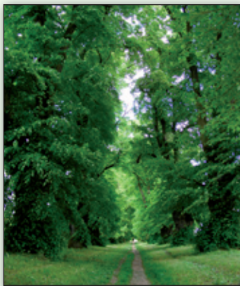
Zabytkowa aleja już niebawem doczeka się oświetlenia.