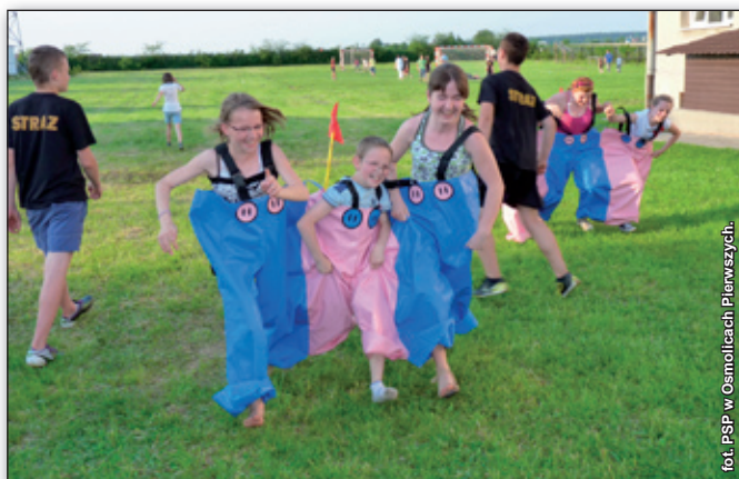
Jedną z atrakcji festynu rodzinnego były biegi w trójspodniach.

z rodziną w niedzielne popołudnie. Mogli oni liczyć na świetną zabawę i różne atrakcje. Dzieci świetnie bawiły się na torze samochodzikowym oraz dmuchanym zamku. Najmłodszych cieszyło malowanie twarzy, konkurs plastyczny pt. „Moja rodzina” oraz różne zabawy prowadzone przez nauczycieli. Wszyscy z ciekawością oglądali pokazy gaszenia pożaru przez strażaków, zawo-