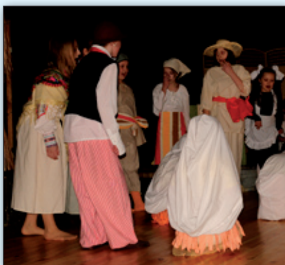
Teatr „Kaprysek” z CKiP w Piotrowicach.