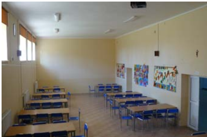
Remont stołówki szkolnej w PSP w Bystrzycy Starej.

W 2018 r. przeprowadzono remonty we wszystkich placówkach oświatowych na terenie gminy. Wykonano m.in.: