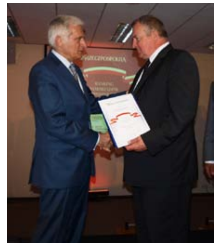
Wręczenia Wyróżnień w Rankingu Samorządów Rzeczypospolitej z ręk J. Buzka Przewodniczącego Parlamentu Europejskiego, Warszawa, 2011 r.