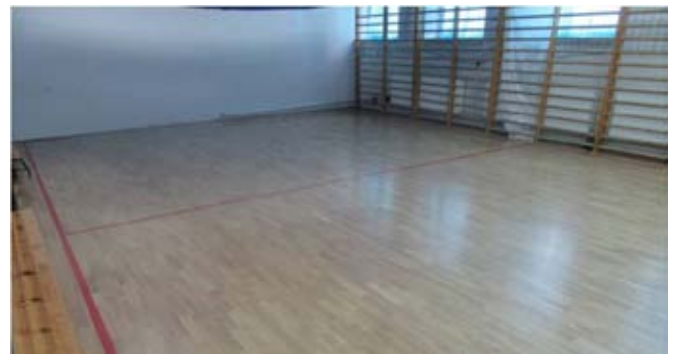
Renowacja podłogi w sali gimnastycznej w PSP w Kietczewicach Górnych.

Łącznie remonty wyniosły: 95 975,46 zł. Źródło finansowania: środki z budżetu gminy i budżetu szkoły. Zakupy sprzętów wyniosły: 62 825,01 zł w całości pokryte ze środków z budżetu szkoły. W 2016 r. zakupiono 1 904 książki dla wszystkich szkół podstawowych z terenu gminy. Całkowita wartość zakupu: 31 201,11 zł, w tym dotacja w kwocie: 24 960,00 zł.