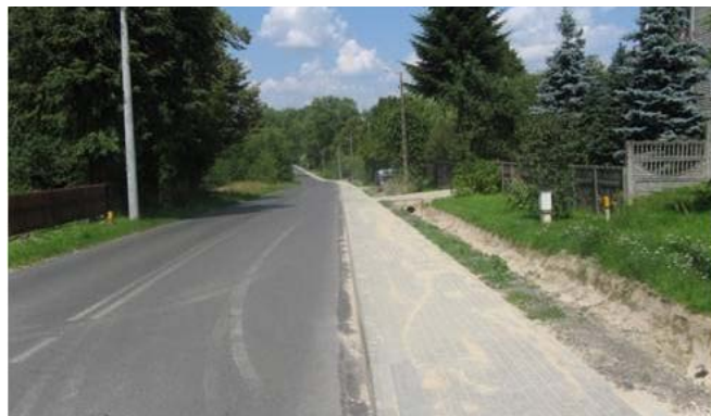
Przebudowa chodnika przy drodze powiatowej w Kietczewicach Górnych.