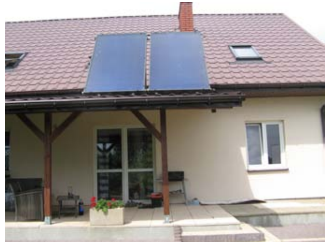
Montaż kolektorów słonecznych na terenie gminy Strzyżewice.

Całkowita wartość projektu: 5 050 386,00 zł. Finansowanie: RPO WL na lata 2014-2020: 3 971 370,00 zł, środki z budżetu gminy 1 079 016,00 zł. Planowany okres realizacji: listopad 2018.