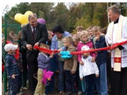
Otwarcie placu zabaw Borkowizna - 2011 r.