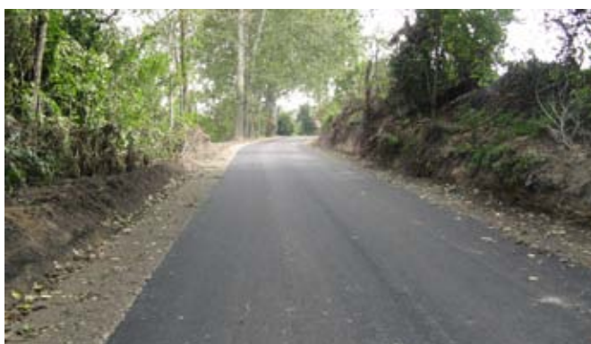
Przebudowa drogi gminnej nr 112523L w Kietczewicach Górnych (zjazd do mostu w Borkowiznie).