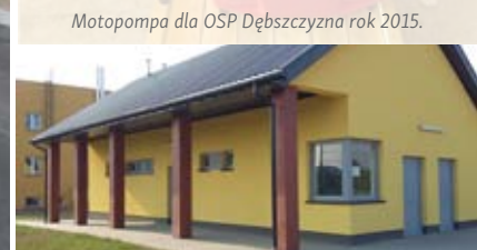
Budynek sanitarno-szatniowy przy kompleksie boisk sportowych w Bystrzycy Starej - rok 2015.