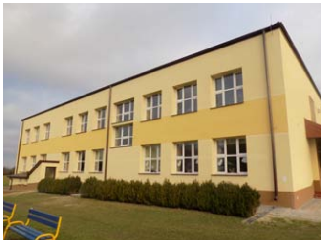
Termorenowacja budynku PSP w Osmolicach Pierwszych.