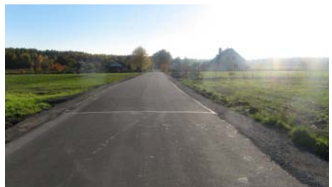
Przebudowa drogi gminnej nr 107136L - odcinek w Pawłowie.