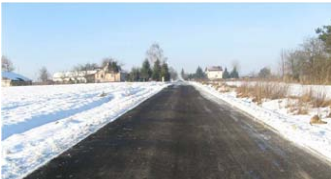
Przebudowa drogi gminnej nr 107121L w Osmolicach Pierwszych.