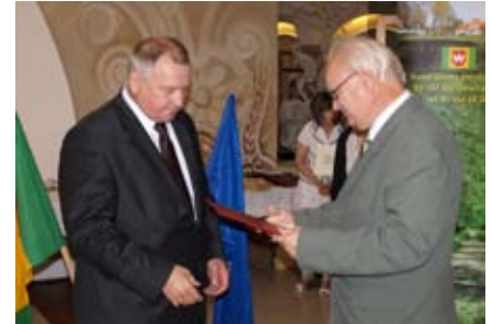
Odnaczenie medalem Wojewody Lubelskiego - XX-lecie Samorządu, 2010 r.