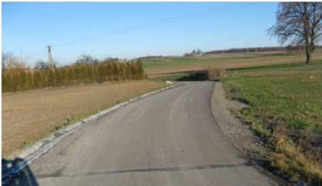
Droga gminna w Pawłótku odcinek 95 m finansowany z budżetu gminy.