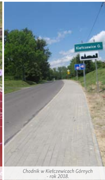
Chodnik w Kietczewicach Górnych - rok 2018.