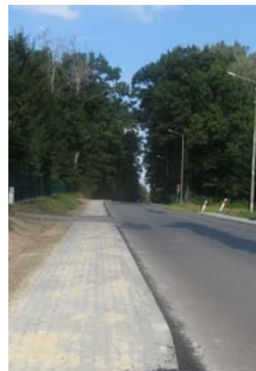
Przebudowa chodnika przy drodze powiatowej w Piotrowicach.