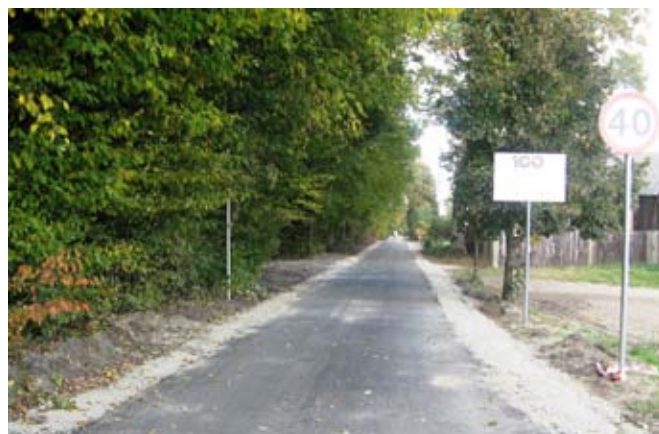
Droga gminna nr 112484L w Osmolicach Drugich