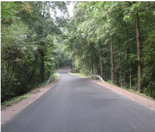
Przebudowa drogi gminnej nr 107140L w Kolonii Kietczewice Dolne.