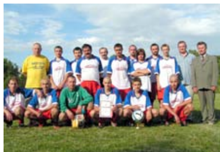
Turniej piłkarski o Puchar Wójta Gminy, 2004 r.