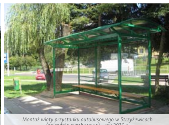
Montaż wiaty przystanku autobusowego w Strzyżewicach (zajezdnia autobusowa) - rok 2016 r.