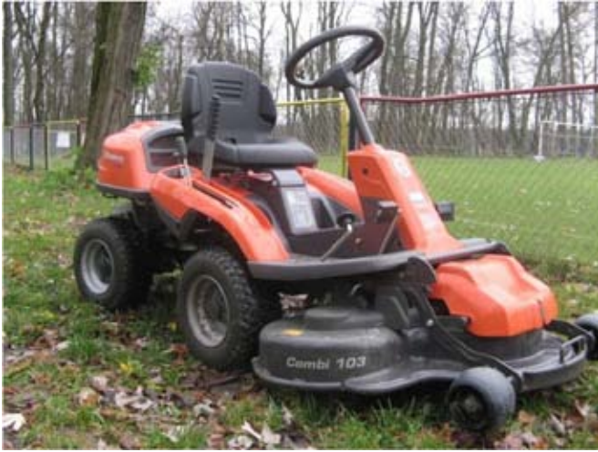
Zakup kosiarek samojezdnych.

W 2017 r. gmina zakupiła 2 kosiarki samojezdne Husqvarna na potrzeby utrzymania dwóch boisk sportowych w Piotrowicach i Strzyżewicach oraz terenów zielonych w centrum Strzyżewic za łączną kwotę: 23 679,00 zł.