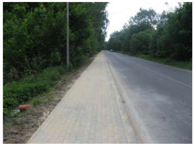
Chodnik w Kietczewicach Dolnych przy drodze powiatowej nr 2289L