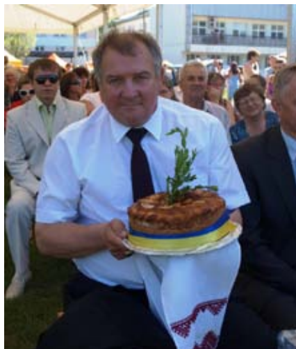
Lubelskie Miodobranie, 2011 r.