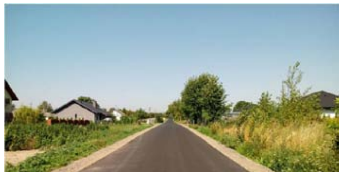
Przebudowa drogi gminnej nr 107122L w Osmolicach Pierwszych (droga szkolna).