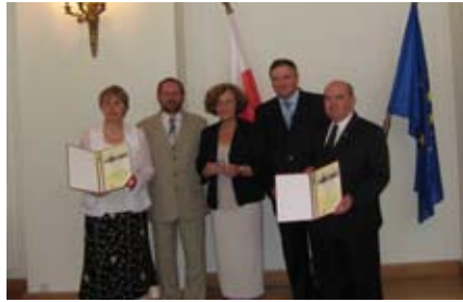
Mecenas Polskiej Ekologii. Pałac Prezydencki, Warszawa, 2006 r.