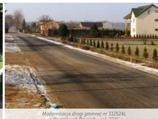
Modernizacja drogi gminnej nr 112524L w Osmolicach Drugich - rok 2016.