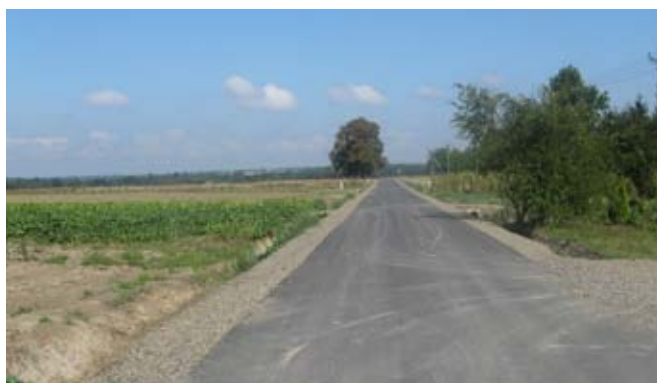
Przebudowa drogi gminnej nr 107120L w Osmolicach Drugich.