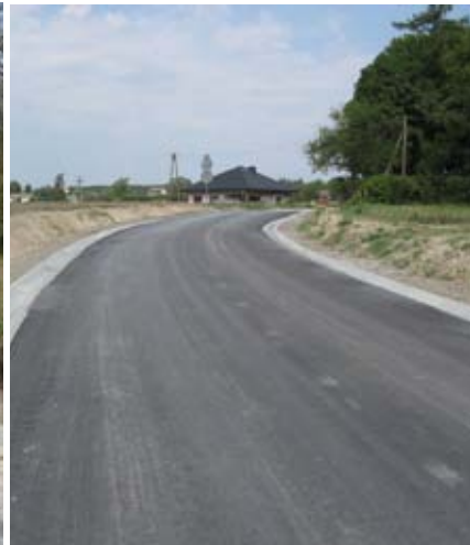
Droga gminna Nr 112496L w Piotrowicach (za parkiem) - rok 2018.