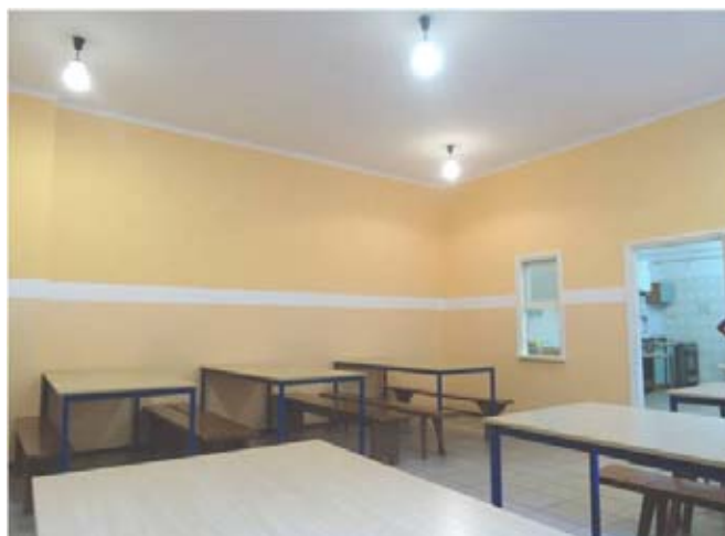
Remont stołówki szkolnej w PSP w Żabiej Woli.