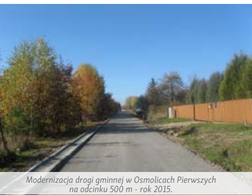
Modernizacja drogi gminnej w Osmolicach Pierwszych na odcinku 500 m - rok 2015.