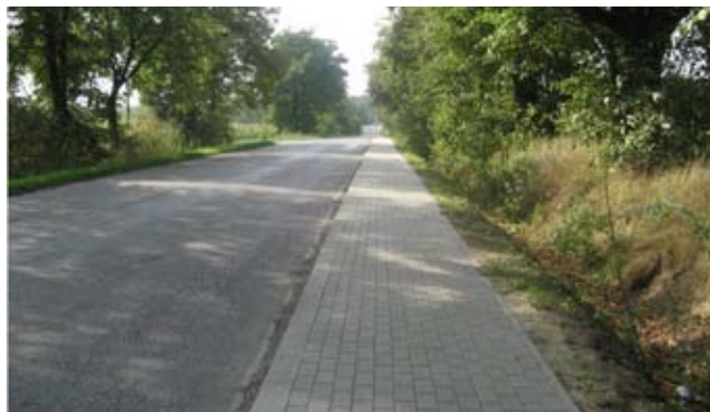
Chodnik w Osmolicach Pierwszych przy drodze powiatowej nr 2277L.