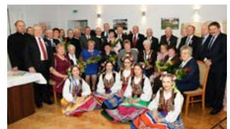
Złote gody - 2016 r.