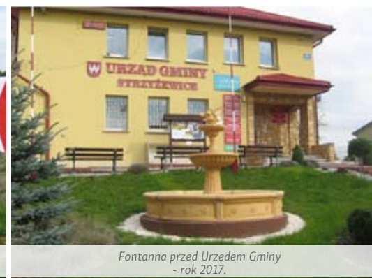
Fontanna przed Urzędem Gminy - rok 2017.