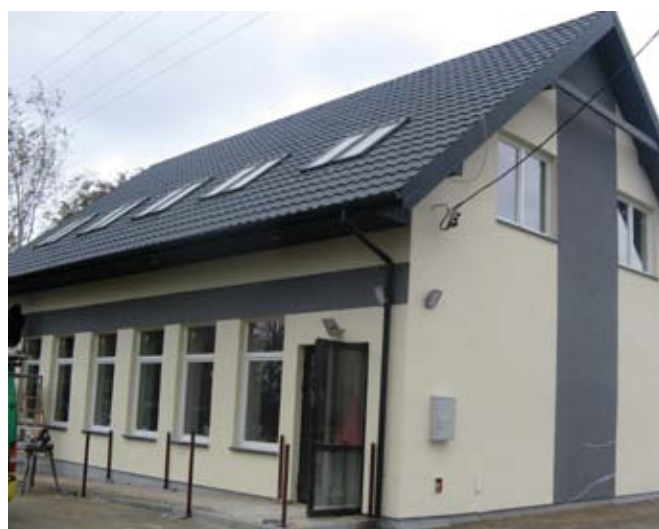
Rozbudowa świetlicy wiejskiej w Osmolicach Pierwszych.

Rozbudowa budynku w Osmolicach Pierwszych na potrzeby świetlicy wiejskiej w ramach poddziałania „Wsparcie na wdrażanie operacji w ramach strategii rozwoju lokalnego kierowanego przez społeczność” w ramach działania „Wsparcie dla rozwoju lokalnego w ramach inicjatywy LEADER” objętego Programem Rozwoju Obszarów Wiejskich na lata 2014 – 2020 w zakresie 4.6 Budowa lub przebudowa ogólnodostępnej i niekomercyjnej infrastruktury turystycznej lub rekreacyjnej, lub kulturalnej. Przedmiotem projektu jest adaptacja budynku na potrzeby świetlicy wiejskiej w Osmolicach Pierwszych oraz zakup wyposażenia, które będzie niezbędne do korzystania ze świetlicy oraz prowadzenia działań w ramach oferty społeczno – kulturalnej. Koszt całkowity: 651 428,03 zł. Kwota dofinansowania: 300 000,00 zł. Termin realizacji listopad 2018 r.