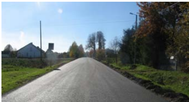
Przebudowa nawierzchni na drodze powiatowej nr 2268L Nowiny-Osmolice w Osmolicach Pierwszych.