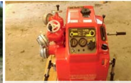
Motopompa dla OSP Dębszczyzna rok 2015.