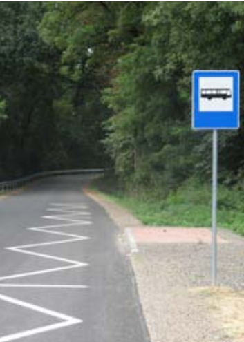
Przebudowa drogi gminnej nr 107140L w Kolonii Kietczewice Dolne - rok 2018.