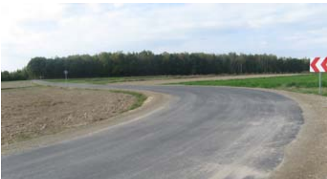
Budowa drogi gminnej nr 107132L w Pawtówku.