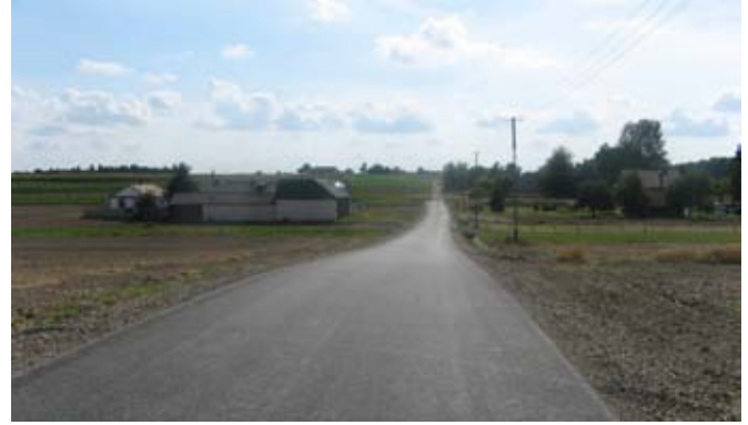
Przebudowa drogi gminnej nr 107129L w Kajetanówce.