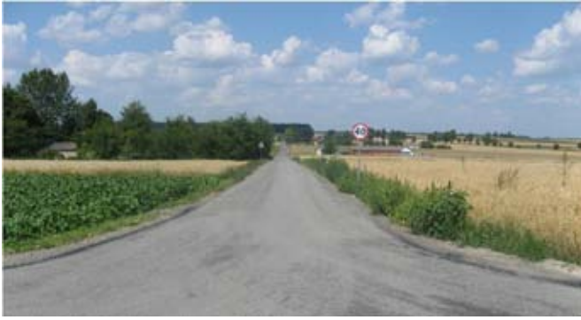
Przebudowa drogi gminnej nr 107129L w Kajetanówce.