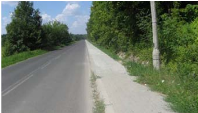
Przebudowa chodnika przy drodze powiatowej w Kietczewicach Dolnych.