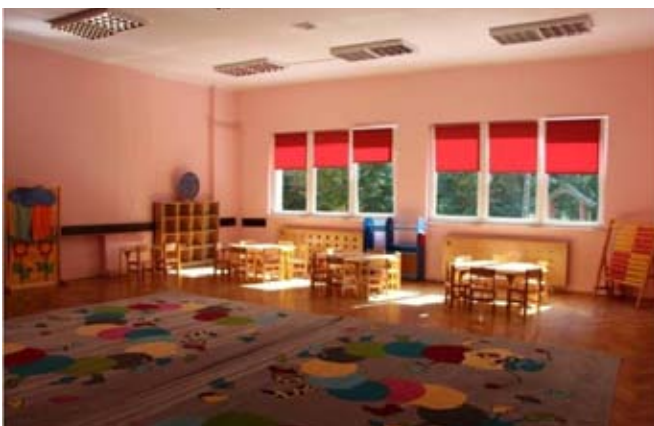
Remont pomieszczeń SPP w Piotrowicach.

W 2017 roku oddano do użytku 7 odcinków dróg o nawierzchni asfaltowej o łącznej długości 3 863 m, w tym nowe drogi: 2 015 m, przebudowa dróg o istniejącej nawierzchni asfaltowej w złym stanie technicznym: 1 848 m. Całkowity koszt inwestycji związanych z budową i przebudową dróg gminnych wyniósł: 2 499 499,15 zł, w tym koszty poniesione z budżetu gminy w kwocie 1 619 424,15 zł.