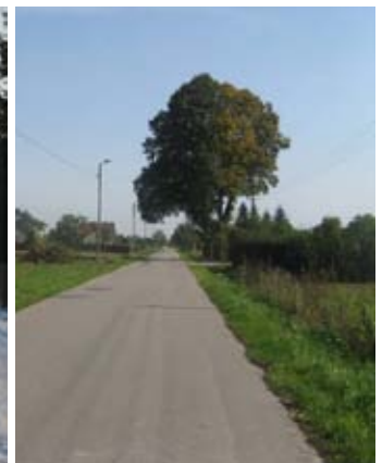
Budowa oświetlenia w Piotrowicach.