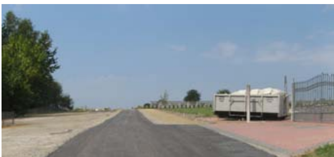
Droga wewnętrzna w Bystrzycy Starej przy cmentarzu.