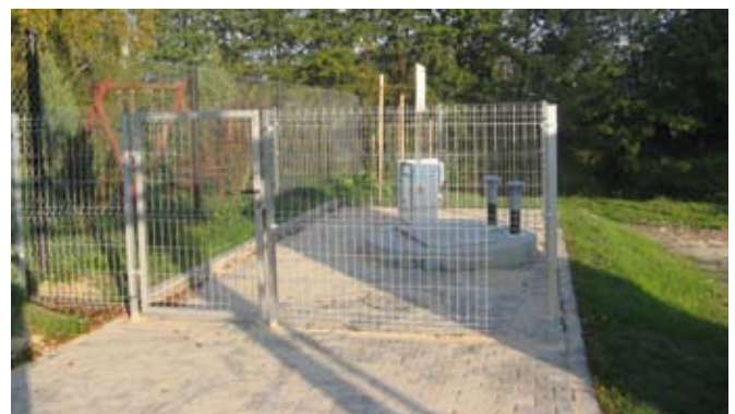
Budowa sieci kanalizacyjnej w Strzyżewicach.

Opracowanie tekstu i wybór zdjęć: Magdalena Baran, Agata Krzyżanek, Natalia Moryl, Joanna Samborska, Anna Siatkowska.