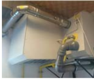
Nagrzewnica w OSP Piotrowice.