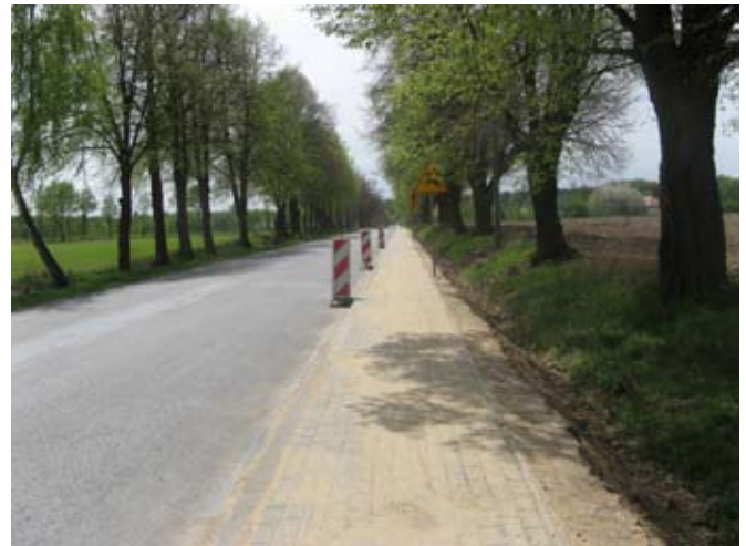
Chodnik w Osmolicach Pierwszych przy drodze powiatowej nr 2277L.

W 2018 r. we współpracy z Powiatem Lubelskim wybudowano 774 m chodników przy drogach powiatowych w miejscowościach: Kietczewice Górne, Kietczewice Dolne, Osmolice Pierwsze. Koszt wymienionych zadań inwestycyjnych po stronie Gminy Strzyżewice wyniósł: 157 345,00 zł.