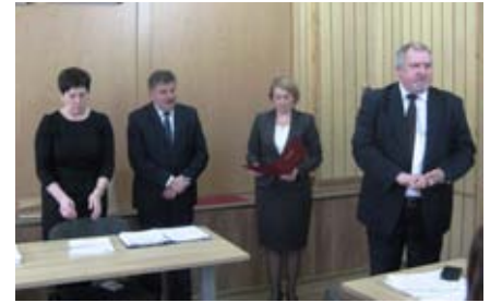
Wręczenie stypendium Wójta Gminy Strzyżewice, 2018r.