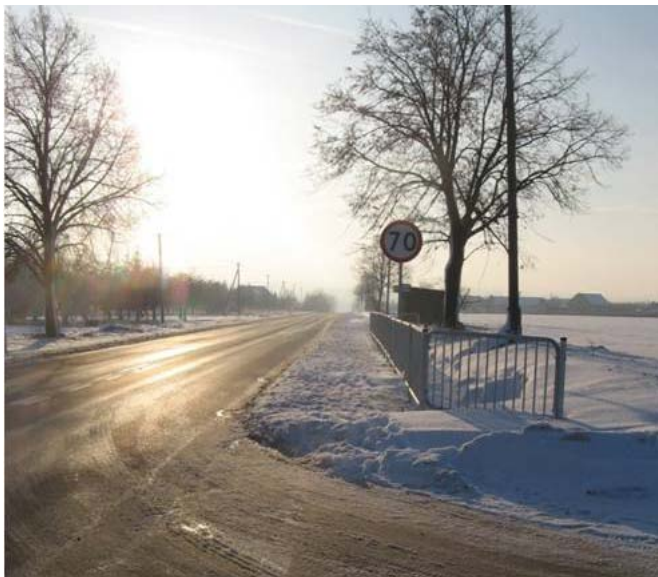
Budowa chodnika przy drodze wojewódzkiej nr 834 w Bystrzycy Nowej.

W ramach zadania wykonano budowę chodnika, zjazdów i zatonki autobusowej w miejscowościach Strzyżewice oraz Bystrzyca Nowa przy drodze wojewódzkiej Nr 834 (702 m w Strzyżewicach i 420 m w Bystrzycy Nowej) koszt zadania: 617 830,83 zł, źródła finansowania: Województwo Lubelskie: 247 132,33 zł, Gmina Strzyżewice 370 698,50 zł.