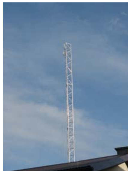
Wykonanie infrastruktury Internetu szerokopasmowego.

W 2018 r. zakończono realizację zadania polegającego na budowie infrastruktury Internetu szerokopasmowego dla Urzędu Gminy Strzyżewice i jednostek organizacyjnych gminy. Jednostki oświatowe, CKiP, biblioteki oraz Urząd Gminy uzyskały dostęp do bardzo szybkiego Internetu dzięki łączu na bazie światłowodu. Koszt zadania: 66 074,24 zł. Źródło finansowania: budżet Gminy Strzyżewice.