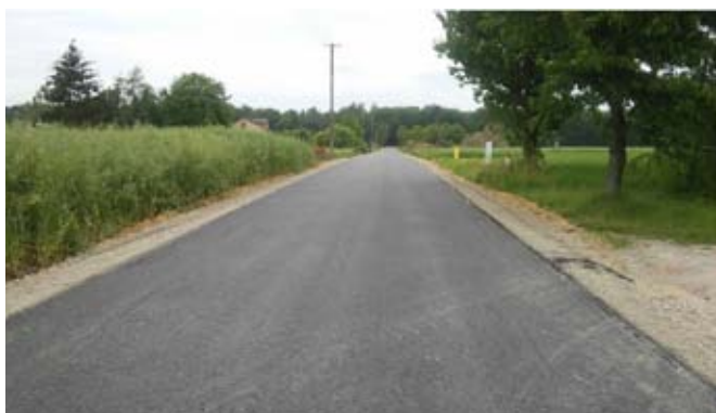
Przebudowa drogi gminnej nr 107131L w Bystrzycy Nowej.