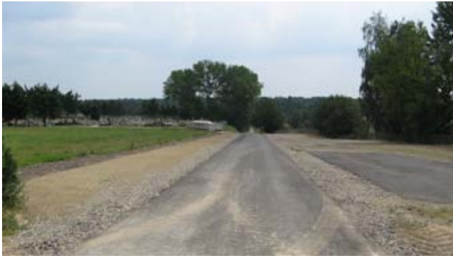
Droga wewnętrzna w Bystrzycy Starej przy cmentarzu.