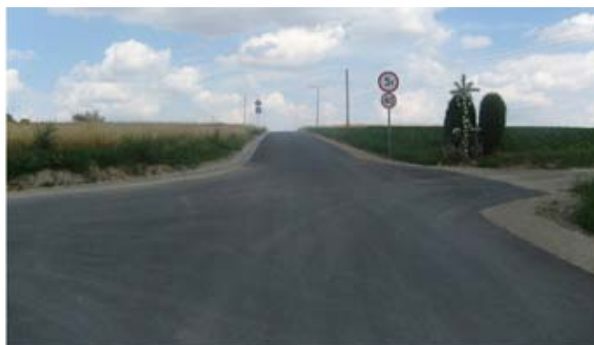
Przebudowa drogi gminnej nr 107144L w Kietczewicach Górnych.