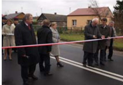
Otwarcie drogi powiatowej Strzyżewice - Kietczewice Górne, 2010 r.