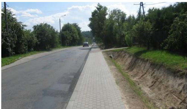
Przebudowa chodnika przy drodze powiatowej w Osmolicach Pierwszych.

W 2016 r. przebudowano chodniki wzdłuż dróg powiatowych: nr 2289L w Kietczewicach Górnych (416 m), Kietczewicach Dolnych (340 m), nr 2277L w Osmolicach Pierwszych (455 m), nr 2269L w Żabiej Woli (300 m), koszt zadania: 286 580,27 zł, źródła finansowania: Powiat Lubelski 114 680,27 zł, Gmina Strzyżewice: 171 900,00 zł.