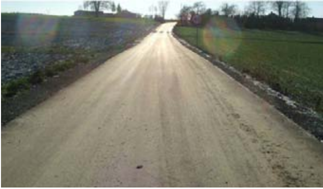
Droga gminna w Pawłótku nr 107132L współfinansowana z MAiC