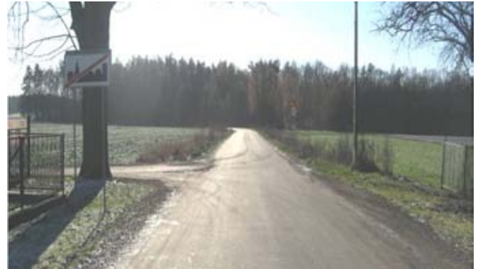
Przebudowa drogi gminnej nr 107133L w Pawłowie.