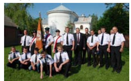
Gminne obchody Dnia Strażaka, 2012 r.