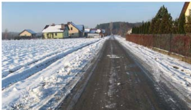
Przebudowa drogi wewnętrznej w Żabiej Woli.