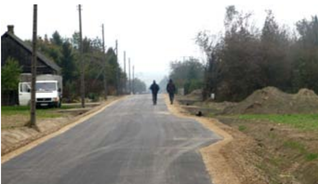
Przebudowa drogi gminnej nr 107139L w Kolonii Kietczewice Dolne.