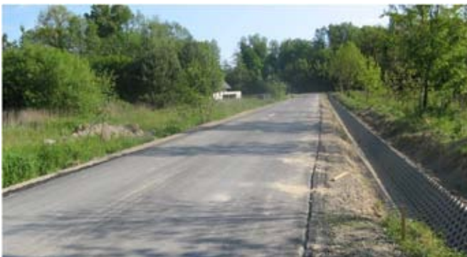
Przebudowa drogi gminnej nr 107128L w Piotrowicach.