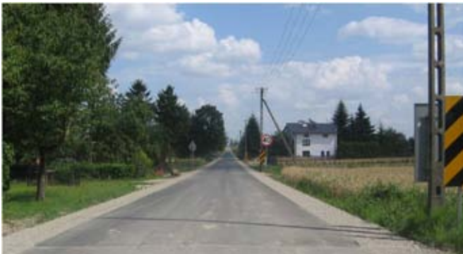
Przebudowa drogi gminnej nr 107131L w Bystrzycy Nowej.