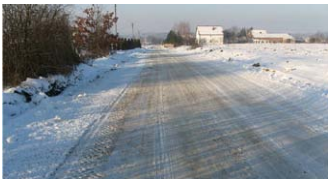
Utwardzenie dna wwozu lessowego w ciągu drogi gminnej nr 112486L w Żabiej Woli.