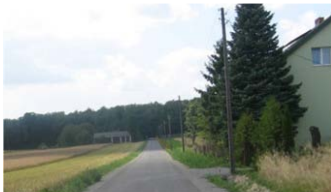
Budowa drogi gminnej nr 107139L w Kolonii Kietczewice Dolne.