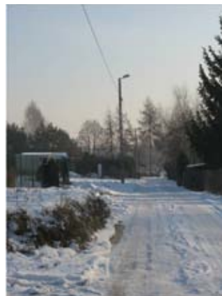
Budowa oświetlenia przy drodze wewnętrznej w Polanówce.

W 2016 r. wykonano oświetlenie uliczne w miejscowości Polanówka (12 punktów oświetleniowych). Całkowity koszt inwestycji: 29 582,58 zł. Zadanie sfinansowano ze środków budżetu gminy.