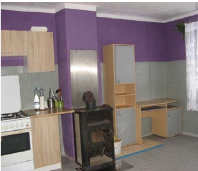
Remont strażnicy OSP we Franciszkowie.

Strażacy własnym staraniem za własne pieniądze (około 7,5 tys. zł) wykonali remont wewnątrz budynku – odnowiono pomieszczenia świetlicy: kuchnię i toalety, zamontowano kominek węglowy i grzejnik elektryczny, ułożono terakotę i glazurę, wymieniono drzwi, okna.