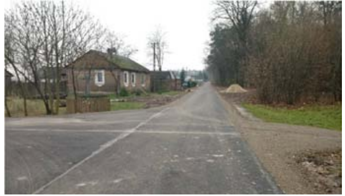
Modernizacja drogi gminnej nr 112484L w Osmolicach Drugich.