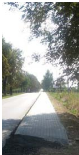
Chodnik przy drodze powiatowej Lublin-Bychawa w Żabiej Woli.