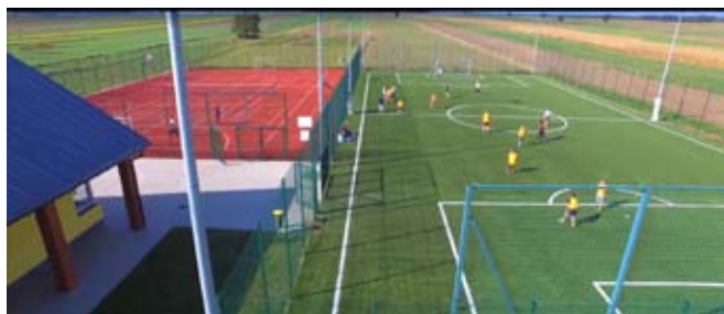
Kompleks boisk sportowych przy ZSP w Bystrzycy Starej.