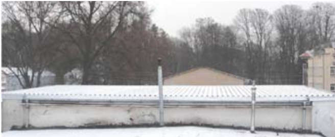
Pokrycie dachowe na strażnicy OSP Żabia Wola.