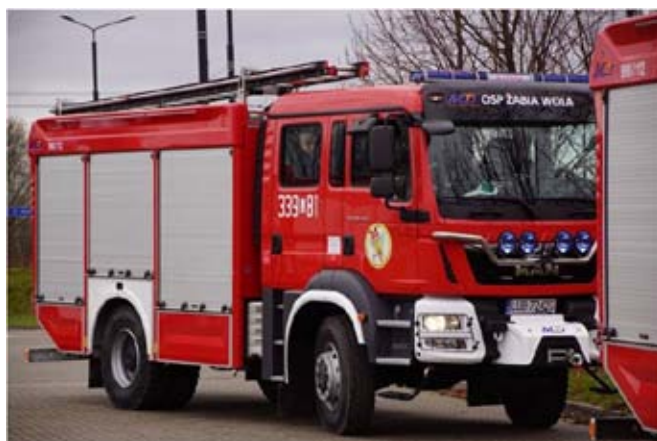
Zakup samochodu ratowniczo-gaśniczego OSP Żabia Wola.

W 2017 r. OSP Żabiej Wola otrzymała średni samochód ratowniczo – gaśniczy zakupiony w ramach partnerskiego projektu „Zabezpieczenie przeciwpożarowe i przeciwpowodziowe województwa lubelskiego poprzez zakup samochodów ratowniczo – gaśniczych dla Ochotniczych Straży Pożarnych” współfinansowanego z Działania 6.1 Bezpieczeństwo ekologiczne Regionalnego Programu Operacyjnego Województwa Lubelskiego na lata 2014-2020. Koszt zakupu samochodu dla OSP Żabia Wola: 747 840,00 zł. Źródła finansowania: EFRR: 442 190,37 zł, budżet gminy: 305 649,63 zł.