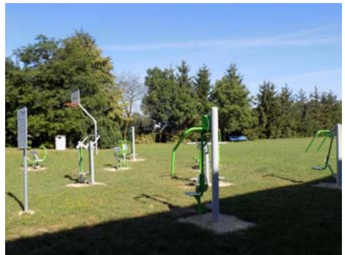
Siłownia zewnętrzna w Osmolicach Pierwszych.

Urządzenia zostały zamontowane w 2018r. Koszt zadania: 49 839,60 zł. Źródło finansowania: budżet CKiP Piotrowice.