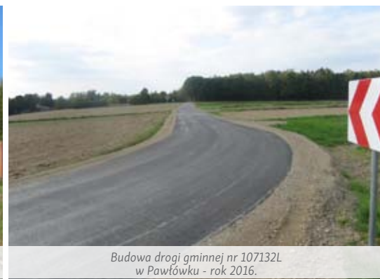
Budowa drogi gminnej nr 107132L w Pawłówku - rok 2016.