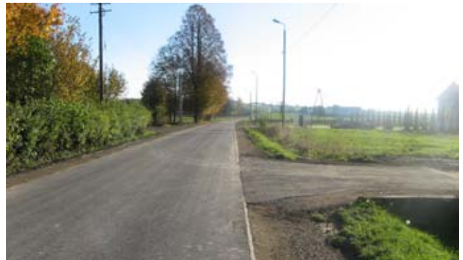
Przebudowa drogi gminnej nr 107136L - odcinek w Dębszczyźnie.