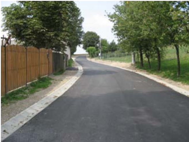
Droga gminna Nr 112496L w Piotrowicach (za parkiem).