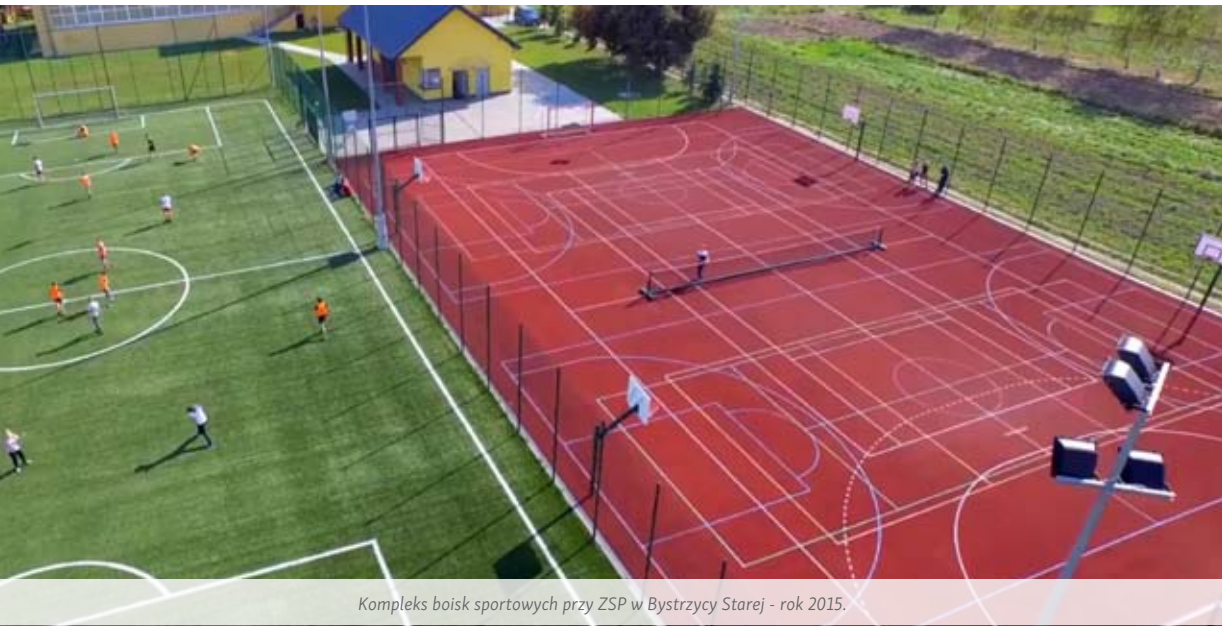
Kompleks boisk sportowych przy ZSP w Bystrzycy Starej - rok 2015.