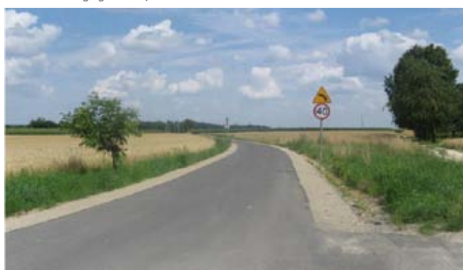
Przebudowa drogi gminnej nr 107142L w Kietczewicach Maryjskich.