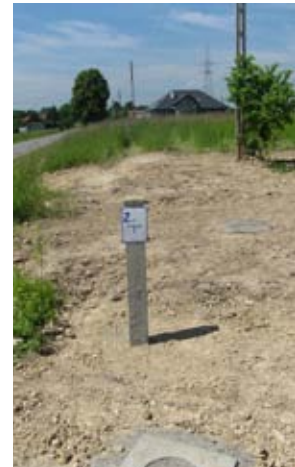
Przebudowa i rozbudowa sieci wodociągowej.