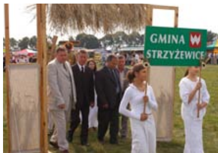
Dożynki Powiatowe w Radawcu, 2005 r.