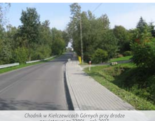
Chodnik w Kietczewicach Górnych przy drodze powiatowej nr 2289L - rok 2017.