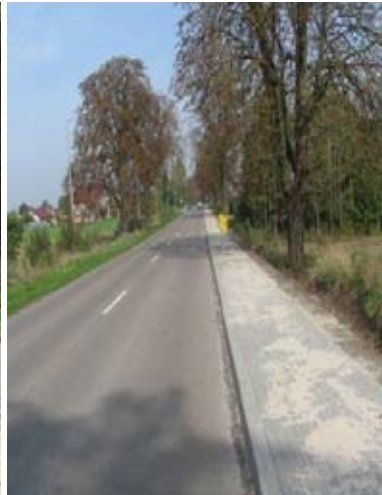
Chodnik w Żabiej Woli przy drodze powiatowej nr 2269L - rok 2017.