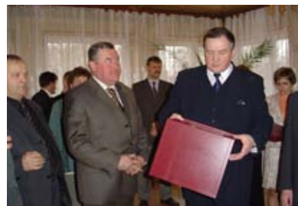
Wręczenia Nagród Roku Wójta Gminy Strzyżewice, 2005 r.