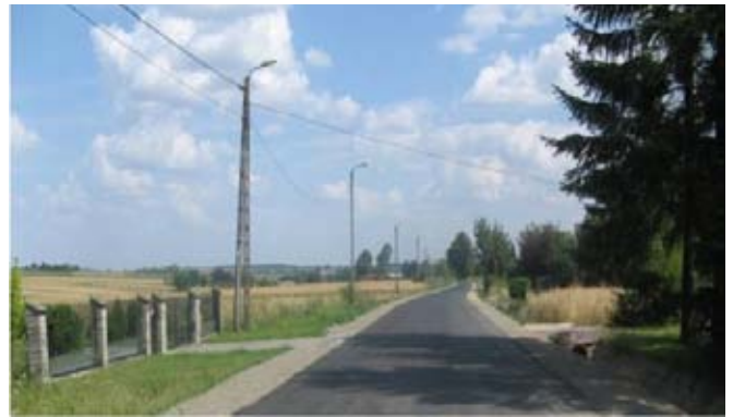
Przebudowa drogi powiatowej nr 2289L we Franciszkowie.