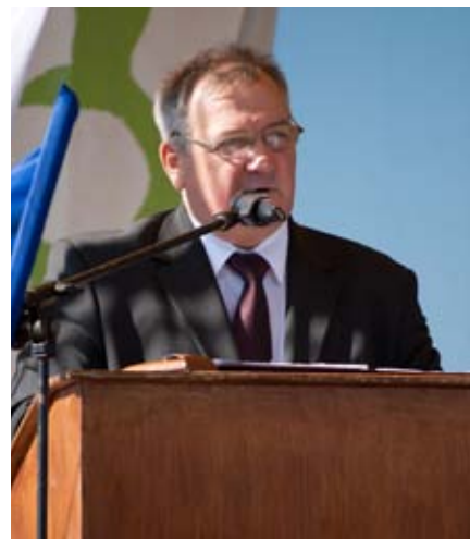
Gminne Święto Plonów, 2011 r.