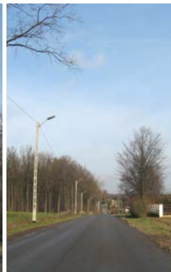
Od lewej: Budowa oświetlenia w Dębinie i Pawłowie