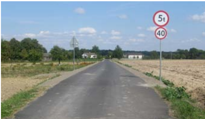
Przebudowa drogi gminnej nr 107144L w Kietczewicach Górnych.