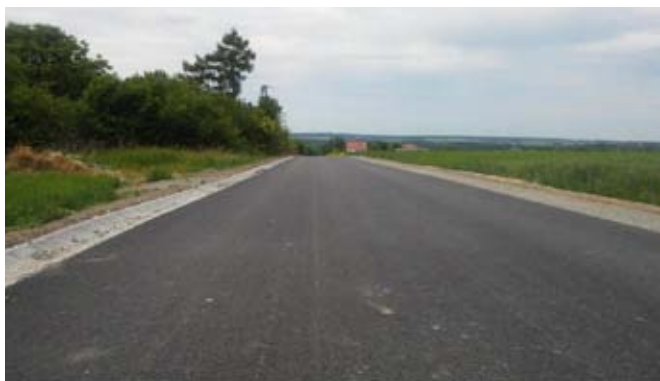
Przebudowa drogi gminnej nr 112486L w Żabiej Woli.