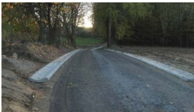
Utwardzenie dna i odwodnienie wąwozów lessowych w ciągu drogi powiatowej nr 2279L w Piotrowicach.