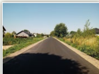
Przebudowana droga gminna nr 107122L w Osmolicach Pierwszych