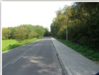
Chodnik przy drodze powiatowej w Kielczewicach Dolnych