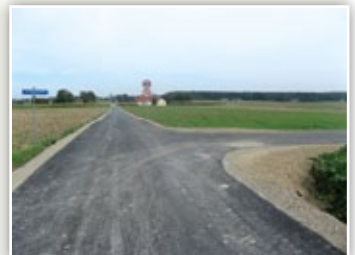
Przebudowa drogi gminnej nr 112511L w Kielczewicach Górnych