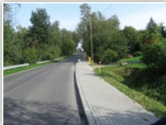
Chodnik przy drodze powiatowej w Kielczewicach Górnych