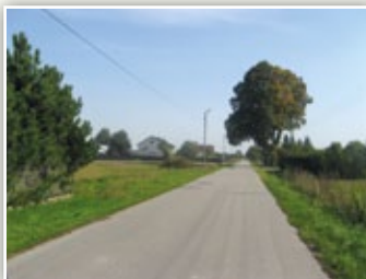
Oświetlenie drogi gminnej w Piotrowicach (Kolonia)