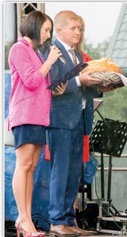
Starostowie dożynek 2017