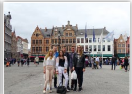
Wizyta w Brugii