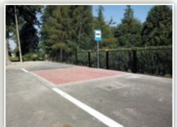
Zatoka przy drodze nr 107122L w Osmolicach Pierwszych