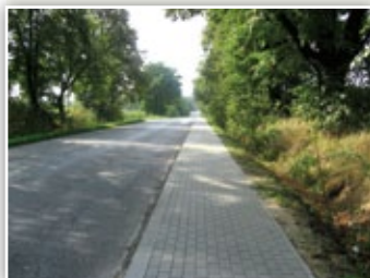
Chodnik przy drodze powiatowej w Osmolicach Pierwszych