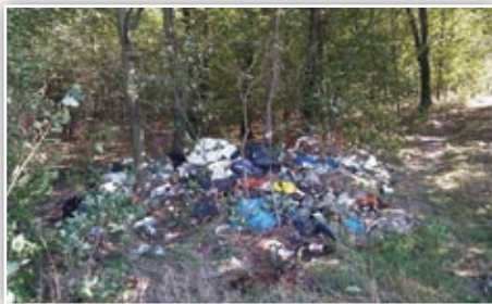
Dzikie wysypisko w lesie w Polanówce

Art. 162. [Zanieczyszczenie lasu] § 1. Kto w lasach zanieczyszcza glebę lub wodę albo wyrzuca do lasu kamienie, śmieci, złom, padlinę lub inne nieczystości, albo w inny sposób zaśmieca las, podlega karze grzywny albo karze nagany. § 2. Jeżeli czyn sprawcy polega na zakopywaniu, zatapianiu, odprowadzaniu do gruntu w lasach lub w inny sposób składowaniu w lesie odpadów, sprawca podlega karze aresztu albo grzywny. § 3. W razie popełnienia wykroczenia określonego w § 1 można orzec nawiązkę, a w razie popełnienia wykroczenia określonego w § 2 orzeka się nawiązkę - do wysokości równej kosztom rekultywacji gleby, oczyszczenia wody, wydobywania, wykopania, usunięcia z lasu, a także zniszczenia lub neutralizacji odpadów.