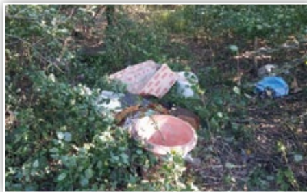
Dzikie wysypisko w lesie w Osmolicach Drugich