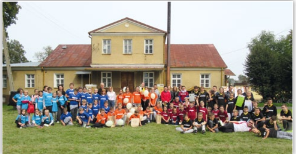
Uczestnicy II Gminnego Rajdu Rowerowego

Pracownicy GBP im. Ewy Kołaczkowskiej w Strzyżewicach