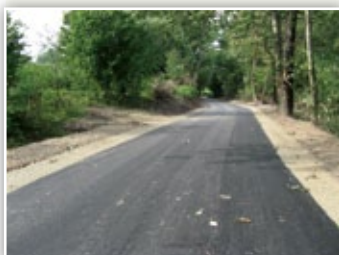
Przebudowa drogi gminnej nr 112523L w Kielczewicach Górnych