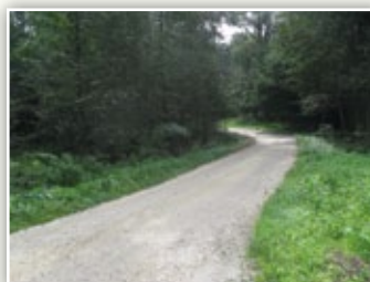
Wyremontowana droga gminna nr 107145L w Borkowiznie