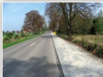
Chodnik przy drodze powiatowej w Żabiej Woli