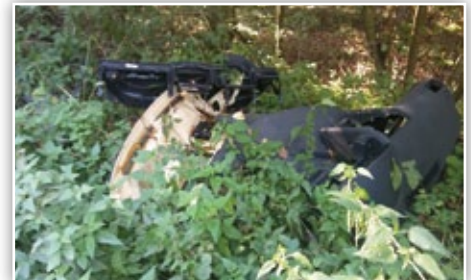
Dzikie wysypisko przy drodze w Kolonii Kielczewice Dolne