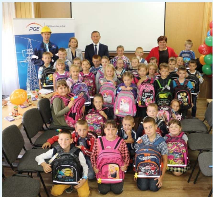
Uczniowie z nowym wyposażeniem