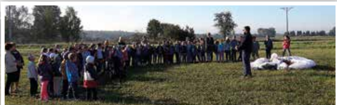
Prezentacja paralotni dla uczniów ZSP w Bystrzycy Starej