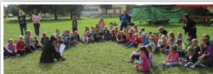
Turniej Wiedzy o Ziemniaku