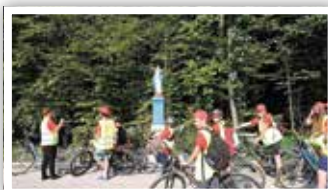
Postój na jeden z przystanków zadaniowych