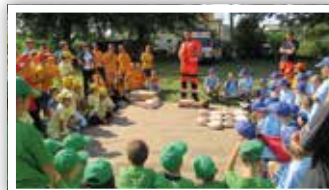
Pokaz pierwszej pomocy przedmedycznej