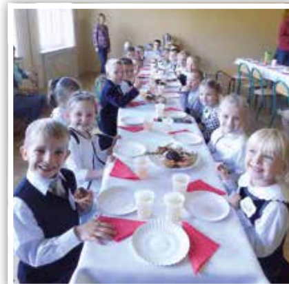
Uroczysty obiad musiał być