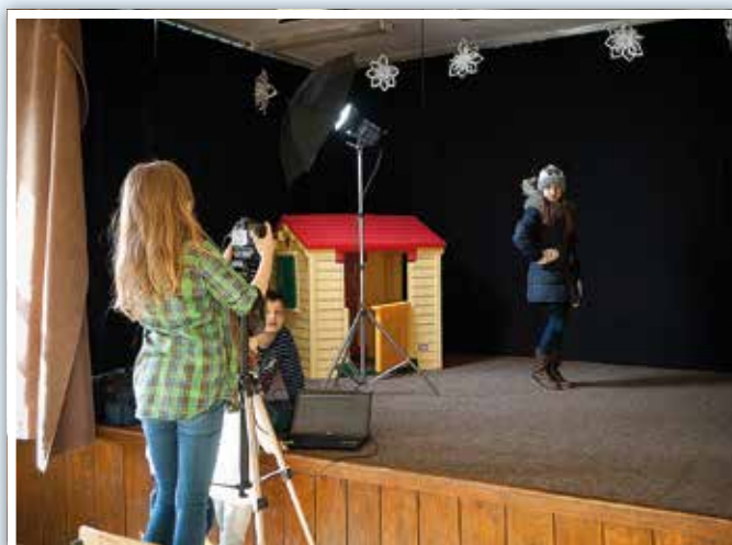
Zajęcia z fotografii studyjnej

Ubiegły sezon pokazał, że wśród dzieci, młodzieży, jak i oczywiście dorosłych istnieje potrzeba bogatej oferty kulturalnej w Naszej Gminie oraz zapotrzebowanie na różne formy aktywności. Zależy nam nie tylko na rozwijaniu talentów, ale także na