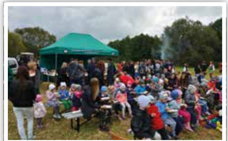
Integracja z Publicznym Przedszkolem w Piotrowicach