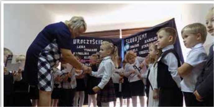
Pani Dyrektor pasuje na zerókwowicza

„Więc Pasowania nadszedł już czas, pierwszy egzamin na ucznia zdasz...”