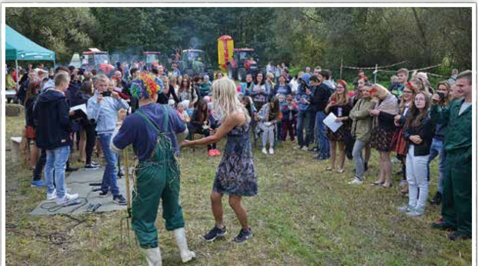
Część artystyczna pt. „Rolnik szuka żony”