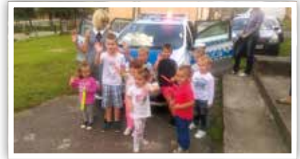
Spotkanie z funkcjonariuszkami Komendy Miejskiej Policji

nariuszki pokazały i wytłumaczyły również maluchom jak powinny się zachować w przypadku ataku psa i zaczepiania ich przez osoby im nieznanne. Wszystkie dzieci otrzymały odbłaski oraz zostały uświadomione o konieczności noszenia ich. Największą atrakcją okazało się oczywiście oglądanie policyjnego