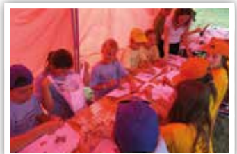
Warsztaty wykonywania toreb ekologicznych