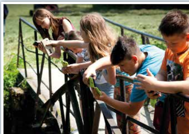
Zajęcia plenerowe z fotografii mobilnej

odkrywaniu pasji wśród odbiorców działań CKiP. W związku z tym w trwającym roku szkolnym pozostajemy przy zajęciach fotograficznych , ale rozwinimy je o tworzenie krótkich form animacyjnych . Niezmiennie też zostaną zajęcia plastyczne i przygoda z grafiką warsztatową . Jednak