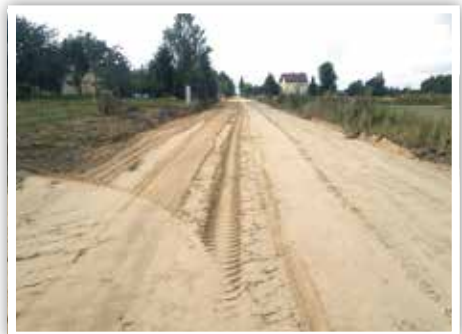
Droga w trakcie przebudowy