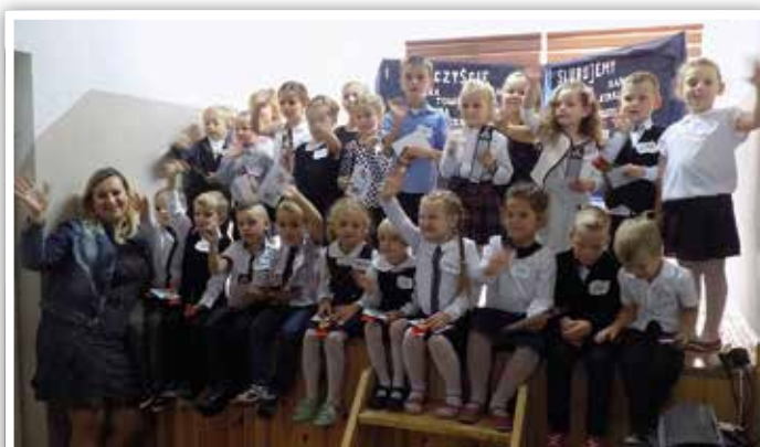
Świeżo upieczeni zerókwowicze