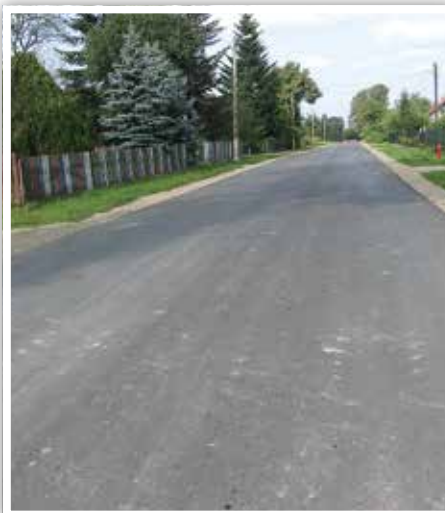
Droga nr 107132L w PawłóWKu