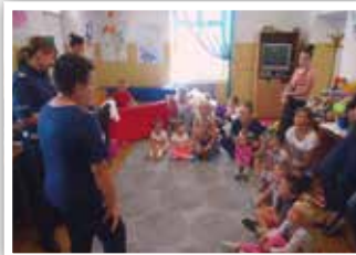
Pogadanka dotycząca zasad bezpieczeństwa

/Pracownicy Gminnej Biblioteki Publicznej im. Ewy Kołaczkowskiej w Strzyżewicach/.