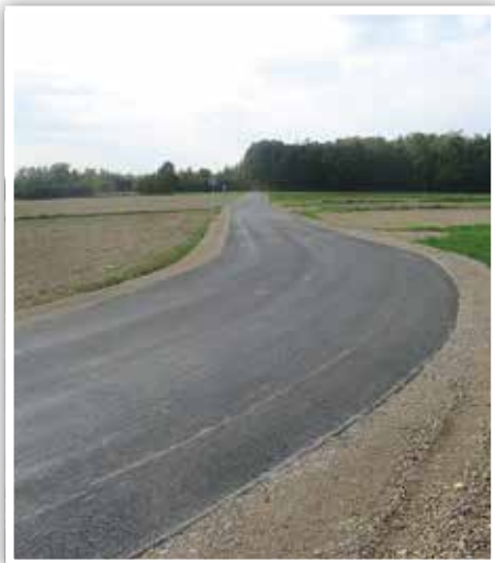
Droga nr 107133L w Pawłowie