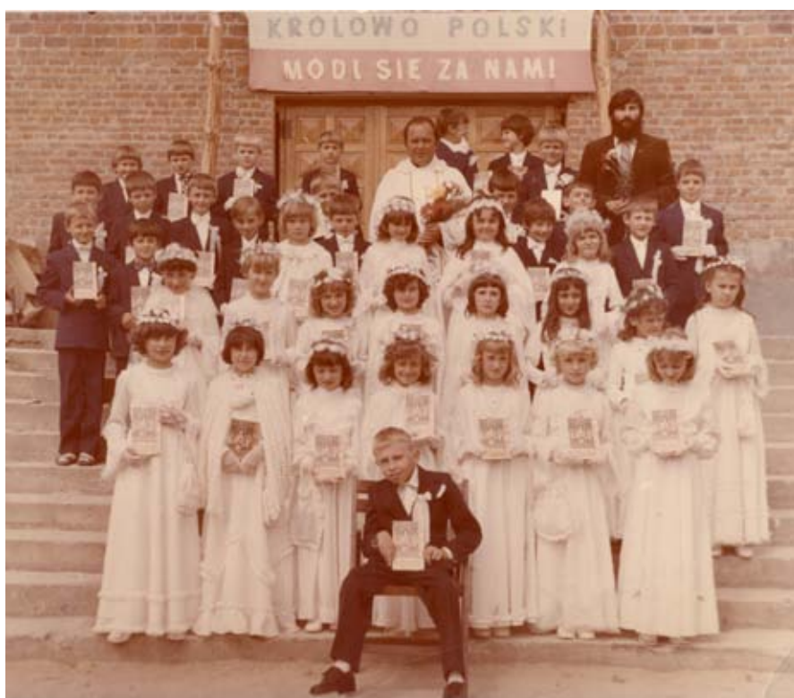
Komunia Św. w Bystrzycy Starej, 29.05.1983 r.