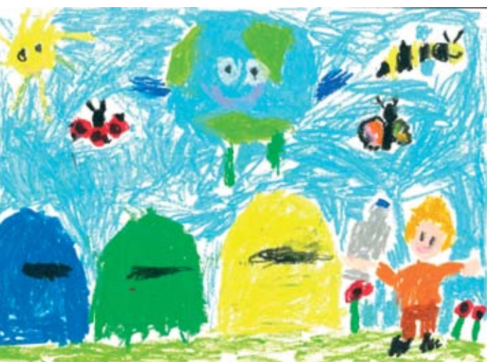
Anna Rzucidło Samorządowe Przedszkole Publiczne w Piotrowicach