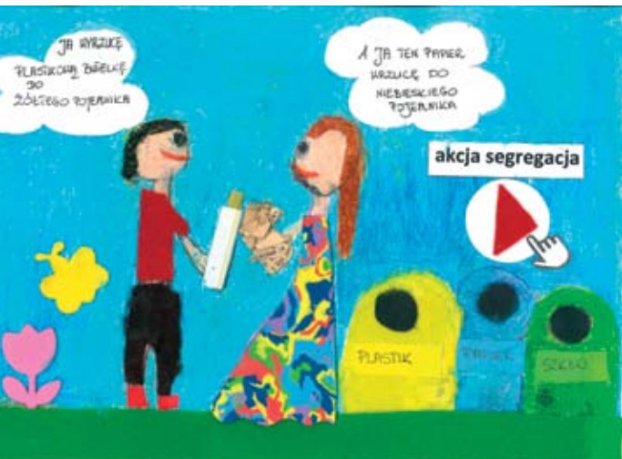
Rober Toporowski Publiczna Szkoła Podstawowa w Kietczewicach Górnych