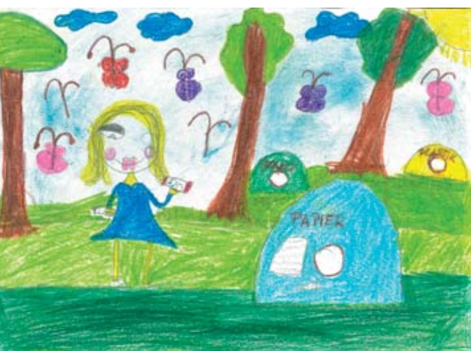
Aleksandra Szwałek Publiczna Szkoła Podstawowa w Bystrzycy Starej