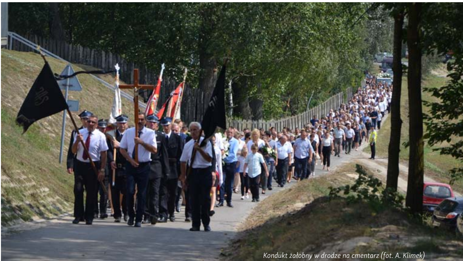
Kondukt żałobny w drodze na cmentarz