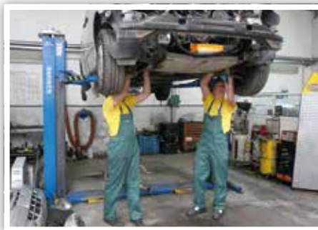
Uczniowie Technikum Samochodowego w warsztacie samochodowym w Portugalii