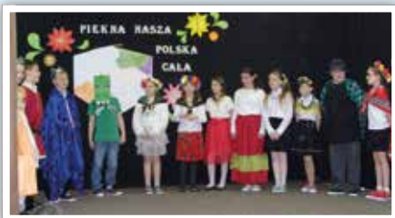
Legenda o Smoku Wawelskim