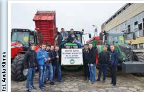
Uczniowie ZSTR prezentują swój sprzęt rolniczy