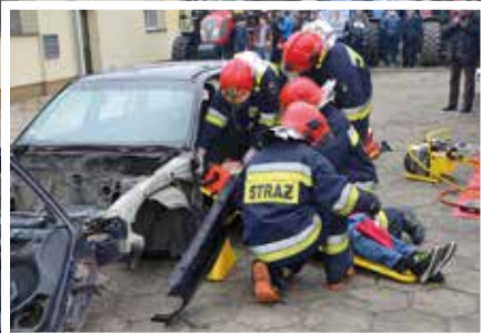
Pokaz ratownictwa w wykonaniu jednostki OSP w Piotrowicach