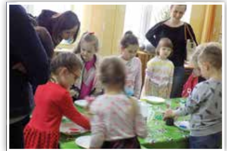
Uczestnicy Dnia Otwartego

W klasie III goście mogli pograć na szkolnych instrumentach perkusyjnych pod nadzorem wychowawczynie klasy III a zarazem nauczycielki muzyki.