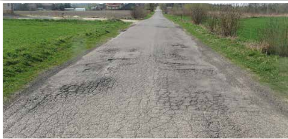
Droga nr 107122L w Osmolicach Pierwszych – stan obecny