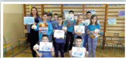
Butelka Wody każdego dnia!

Dnia 22 marca w murach Publicznej Szkoły Podstawowej im. Zofii i Juliusza Stadnickich w Osmolicach uczniowie pod opieką nauczycielki przyrody zorganizowali akcję „Światowy Dzień Wody”. Z tej okazji – wśród uczniów i nauczycieli dominował kolor niebieski, który kojarzy nam się z wodą. Wszystkich wchodzących rano do szkoły czekała tego dnia „niespodzianka na dzień dobry” – butelka wody mineralnej. Samorząd Uczniowski zaprezentował krótką historię Światowego Dnia Wody i wszyscy uczniowie z zaciekawieniem obejrżeli film pt.: „Narodziny kropelki”. Następnie każda klasa zamieniła się w laboratorium. Uczniowie klas III-VI, uczęszczający na zajęcia pozalekcyjne w ramach Akademii Eksperymentów, przygotowali stanowiska do doświadczeń z wodą. Było bardzo ciekawie..., a nawet dziwnie! Wszyscy mieszały, dosypywali, przelewali i dzięki temu, poprzez zabawę mogliśmy obserwować i wyjaśniać zjawiska zachodzące w przyrodzie.