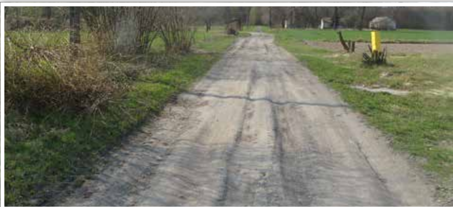
Droga nr 107131L w Bystrzycy Nowej – stan obecny