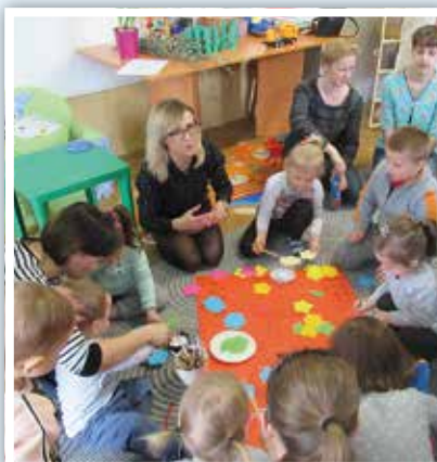
Dzień Wiosny u Maluszków