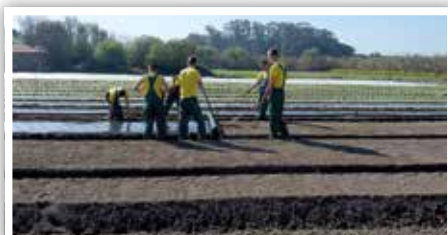
Uczniowie Technikum Mechanizacji Rolnictwa przy sadzeniu kapusty w Portugalii