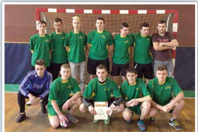
Szcypiorniści z Pszczelej Woli