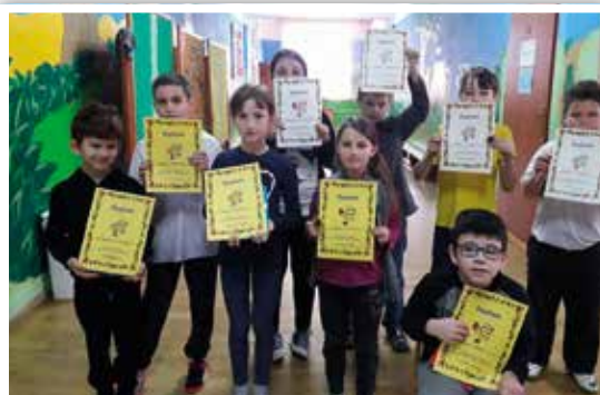
fot. Urszula Tomusiak

Zwycięzcom jeszcze raz serdecznie gratulujemy i życzymy dalszych sukcesów. U. Tomusiak/M. Słowikowska