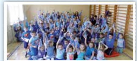
Butelka Wody każdego dnia!