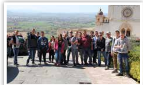
Wycieczka do Asyżu – Włochy