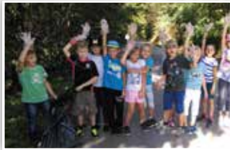
Akcja Sprzątanie Świata PSP w Kiełczewicach Górnych