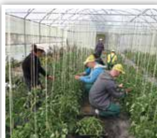
Praktyki w Gospodarstwie Agroturystycznym

Projekt „Na staż po doświadczenie II 2015/2016 ” objął 72 uczniów naszej szkoły i w latach 2017/2018 będzie kontynuowany.