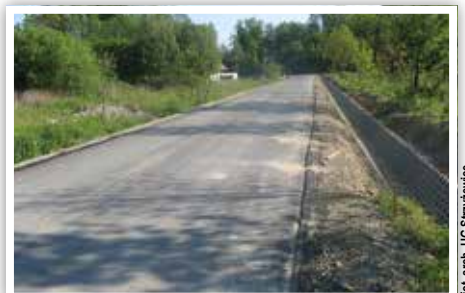
Droga nr 107128L w Piotrowicach