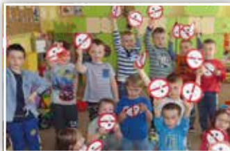
Czyste powietrze wokół nas PSP w Kiełczewicach Górnych

rocznie biorą czynny udział w akcji „Sprzątanie Świata” oraz w obchodach „Dnia Ziemi”. Od roku szkolnego 2011/2012 w naszej placówce realizowany jest program Powiatowej Stacji Sanitarnej – Epidemiologicznej „Czyste powietrze wokół nas”.