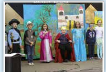
Jak należy dbać o środowisko

W tym roku społeczność PSP w Strzyżewicach – Rechcie włączyła się w akcję obchodów Dnia Ziemi. Uczniowie klasy II i III w bajkowy sposób przybliżyli zebranym jak należy dbać o środowisko. Nad zieloną krainą w której mieszkała Królowa Śmieszka zawisło ogromne niebezpieczeństwo. Zła królowa macocha niszczyła lasy, wody. Nad krajem