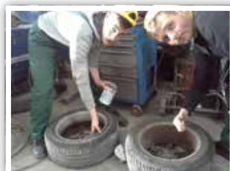
Praktyki w zakładzie samochodowym „Reina”

GUIMARAES - pierwsza stolica Portugalii gdzie urodził się pierwszy król Portugalii Alfons I. Zwiedzaliśmy przepiękny zamek z X wieku, który był pierwotnie twierdzą, chroniącą mieszkańców miasta przed atakami Maurów i Normanów.