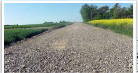
Droga nr 107129L w Kajetanówce