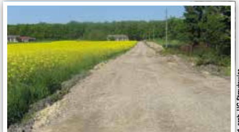
Droga nr 107139L w Kolonii Kielczewice Dolne