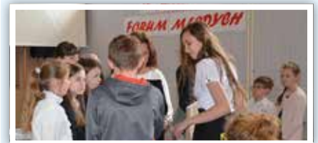
Wręczenie nagród uczestnikom konkursu