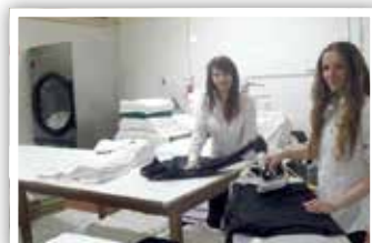
Praktyki w Hotelu do Terco