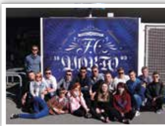
Stadion w Porto