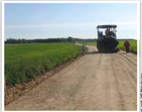
Droga nr 107142L w Kielczewicach Maryjskich