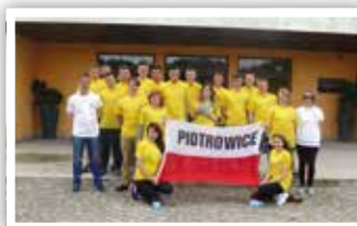
Uczniowie ZSTR w Piotrowicach