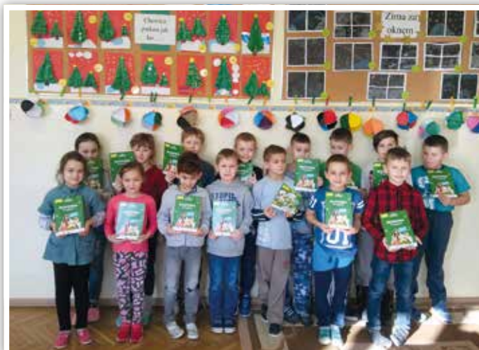
Klasa II B z przepisami na zdrowe przekąski