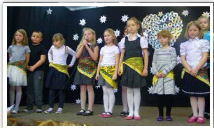
Akademia z okazji Dnia Babci i Dziadka

Występy poszczególnych klas przeplatane były piosenkami oczywiście przepięknymi miłością do dziadków, a na samo za-