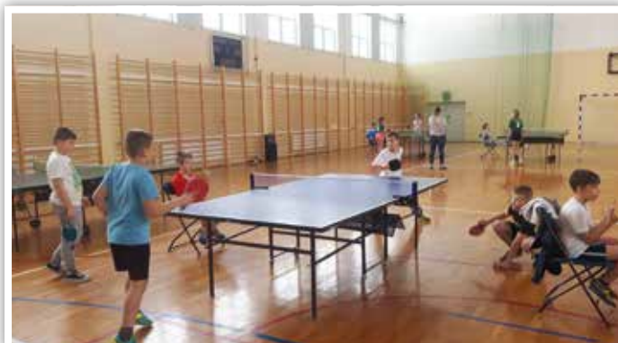
Eliminacje powiatowe w Jabłonie