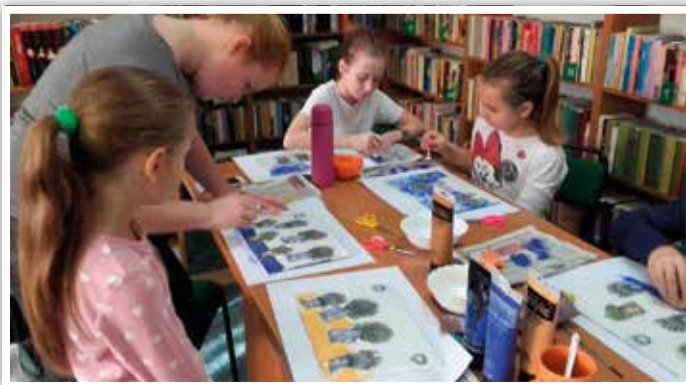
Zajęcia w filii w Kielczewicach