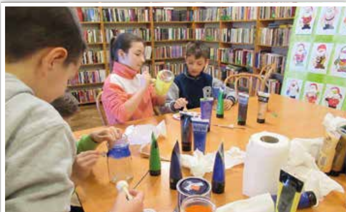
Warsztaty w GBP w Strzyżewicach

Nauczycielki Samorządowego Przedszkola Publicznego w Piotrowicach