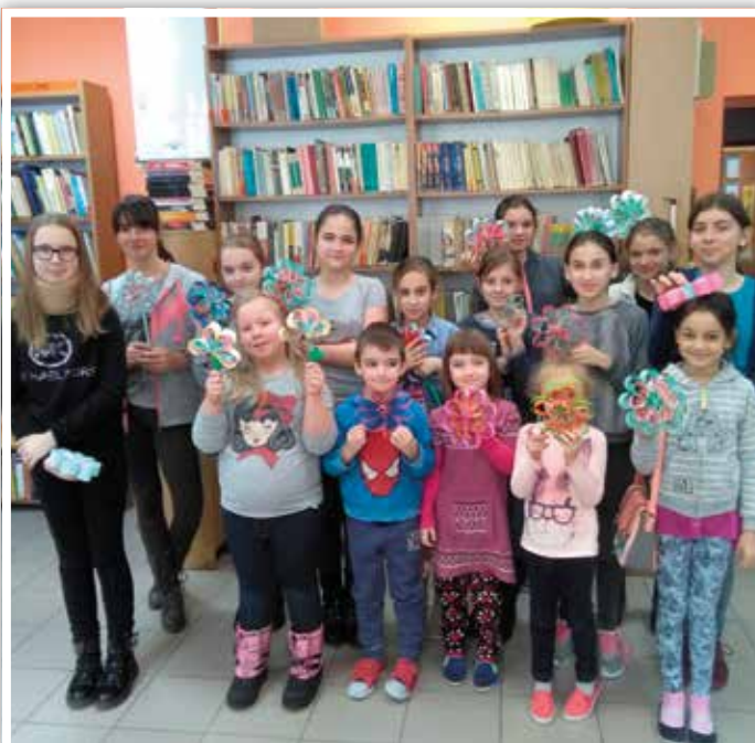
Uczestnicy spotkań w bibliotece w Żabiej Woli