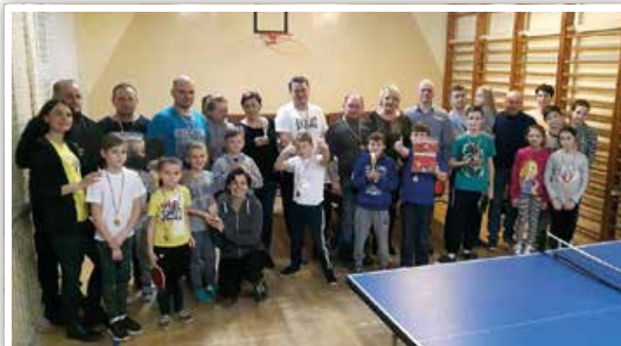
Rodziny Turniej Tenisa Stołowego