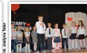
Występ grupy „Zajączków”