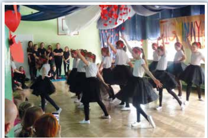
Grupa taneczna ze szkoły w Żabiej Woli