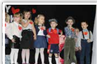
Występ grupy „Motylków”