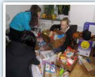
Wielkie liczenie darów