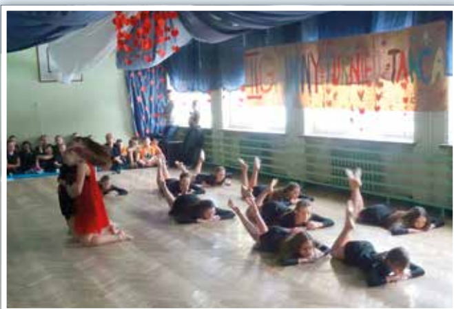
Grupa taneczna „Iskierki” z CKiP Piotrowice