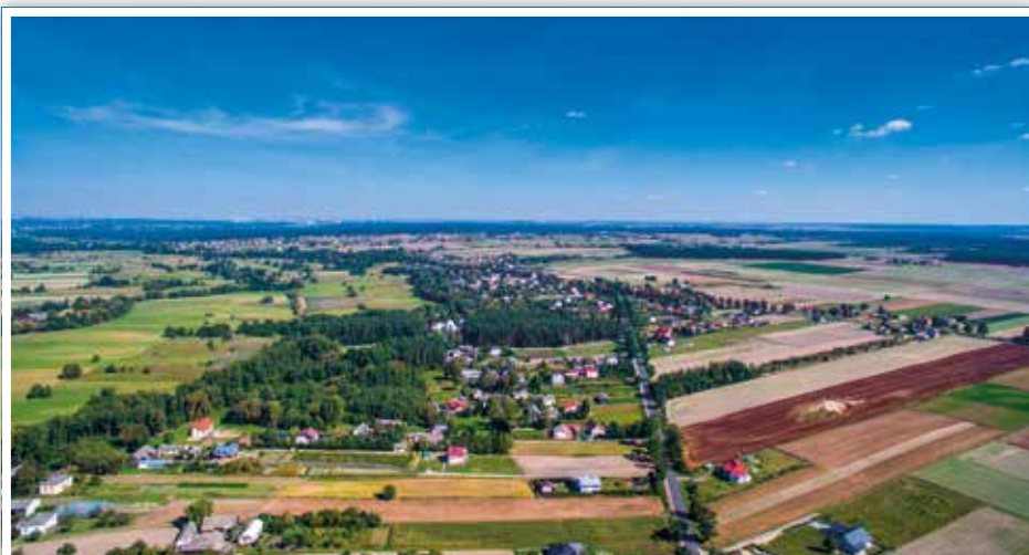
Żabia Wola z lotu ptaka