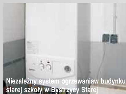
Niezależny system ogrzewania w budynku starej szkoły w Bystrzycy Starej