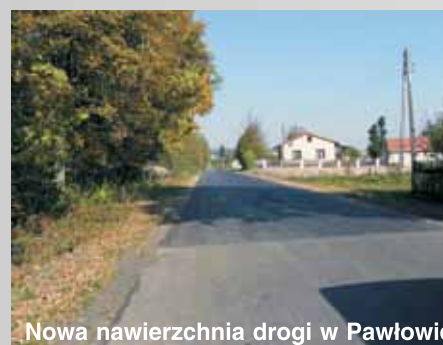
Nowa nawierzchnia drogi w Pawłowie

9) Modernizacja drogi gminnej nr 107133 L w Pawłowie na odcinku 580 m, została wykonana nowa nawierzchnia grubości 6 cm, koszt zadania: 118826,72 zł, sfinansowane z budżetu gminy oraz dotacji ze środków Funduszu Ochrony Gruntów Rolnych w wysokości 95000,00 zł.