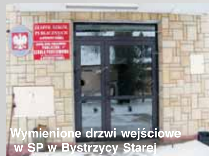
Wymienione drzwi wejściowe w SP w Bystrzycy Starej