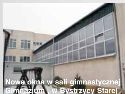
Nowe okna w sali gimnastycznej Gimnazjum w Bystrzycy Starej