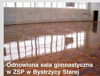
Odnowiona sala gimnastyczna w ZSP w Bystrzycy Starej

6) Remont sali gimnastycznej w Zespole Szkół Publicznych w Bystrzycy Starej zadanie finansowane z budżetu gminy koszt: 106616,94 zł - w ramach remontu wykonano: ułożenie nowego parkietu, malowanie ścian i sufitu, zamontowano nowe oświetlenie i wentylację wywiewną oraz zamontowano nowe wyposażenie sali do gry w koszykówkę i siatkówkę, Łącznie nakłady na prace remontowe w Zespole Szkół Publicznych w Bystrzycy Starej wyniosły 408394,51 zł