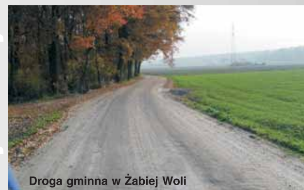
Droga gminna w Żabiej Woli

14) Oświetlenie uliczne w miejscowościach Franciszków (32 lamp), Osmolice Pierwsze (13 lamp), Kielczewice Maryjskie (9 lamp) oraz oświetlenie budynku Urzędu Gminy, łączny koszt wykonania oświetlenia: 69184,68 zł, sfinansowano ze środków budżetu gminy.