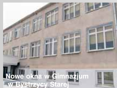
Nowe okna w Gimnazjum w Bystrzycy Starej

5) Termomodernizacja budynku Zespołu Szkół Publicznych w Bystrzycy Starej I etap wymiana stolarki okiennej (18 szt. okien w gimnazjum, 3 szt. okien w łączniku i okna w sali gimnastycznej) i drzwiowej zewnętrznej (2 szt. drzwi wejściowych w Szkole Podstawowej i sali gimnastycznej) - koszt: 99030,45 zł, - przebudowa instalacji ogrzewania (wymiana instalacji c.o. w budynku Szkoły Podstawowej i sali gimnastycznej, montaż niezależnych systemów ogrzewania w budynku starej szkoły) koszt 202747,12 zł, zadanie finansowane z budżetu gminy oraz kredytu Wojewódzkiego Funduszu Ochrony Środowiska i Gospodarki Wodnej w Lublinie w wysokości 220 000,00 zł