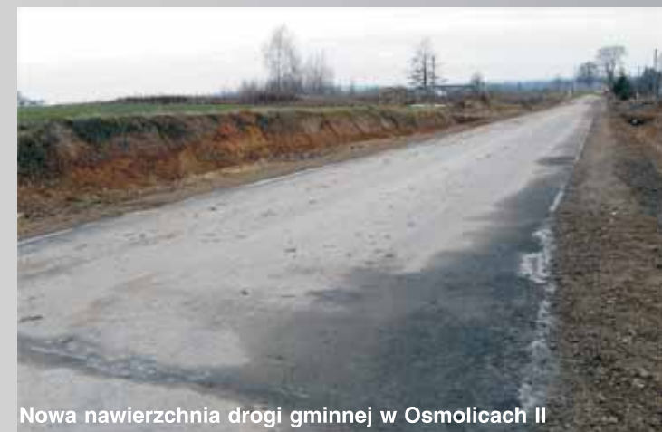
Nowa nawierzchnia drogi gminnej w Osmolicach II

10) Przebudowa nawierzchni drogi gminnej w Osmolicach Drugich na odcinku 200 m, w ramach zadania wykonano drogę o następujących parametrach: szerokość jezdni:4,0 m, pobocza utwardzone obustronne o szerokości 75 cm, koszt zadania: 89586,81 zł, sfinansowane ze środków budżetu gminy i dotacji funduszu usuwania klęsk żywiołowych w wysokości 60 000 zł