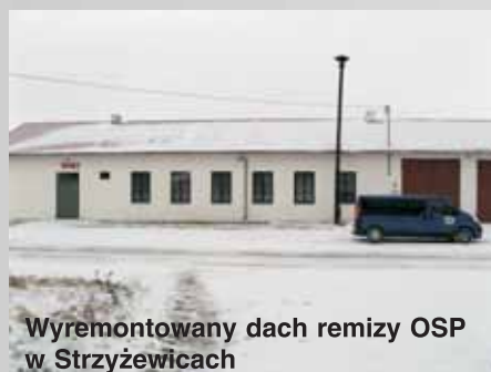
Wyremontowany dach remizy OSP w Strzyżewicach

7) Remont dachu remizy OSP w Strzyżewicach sfinansowana ze środków budżetu gminy koszt: 65000 zł wymiana pokrycia dachowego wraz z odwodnieniem i wzmocnieniem konstrukcji więźby dachowej.