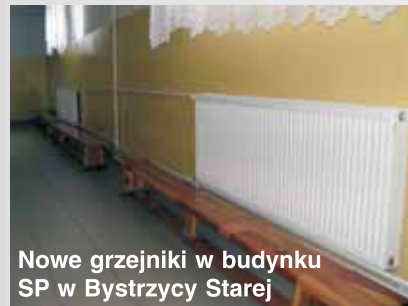
Nowe grzejniki w budynku SP w Bystrzycy Starej