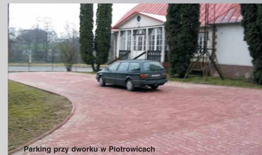
Parking przy dworcu w Piotrowicach