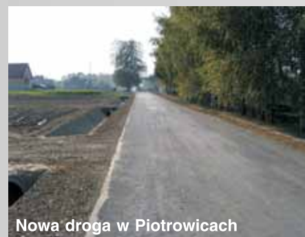
Nowa droga w Piotrowicach

8) Odbudowa drogi gminnej nr 107128 L w Piotrowicach na odcinku 410 m, sfinansowano z budżetu gminy oraz ze środków funduszu usuwania skutków klęsk żywiołowych w wysokości 200 000 zł, koszt zadania: 290058,26 zł, w ramach zadania wykonano drogę o następujących parametrach: szerokość jezdni:4,0 m, pobocza utwardzone obustronne o szerokości 75 cm, jednostronny rów odwadniający umocniony płytami ażurowymi na całej długości odcinka.