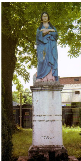
Fot. 6. Pomnik Matki Boskiej Niepokalanie Poczętej w Osmolicach .