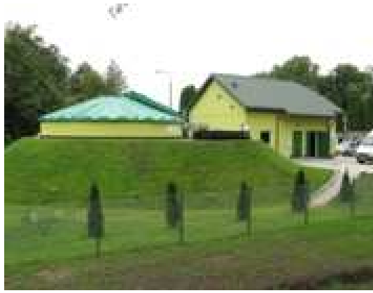
Fot. 13. Oczyszczalnia ścieków w Piotrowicach .