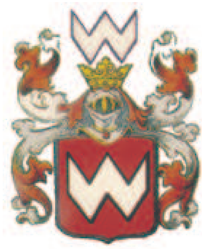
Rys. 3. Herb Strzyżewic .

Herb Abdank to najstarsze znane godło rodowe w Polsce, a jednocześnie jedno z najstarszych w heraldyce europejskiej.