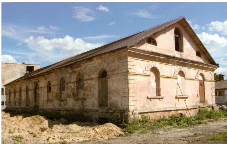
Fot. 9. Dawny spichlerz w Piotrowicach .

Z budynków zespołu folwarcznego zachowały się: murowana oficyna z 1912 r. oraz pochodzący z II połowy XIX w. murowany spichlerz. Budynki te zostały wyremontowane bądź odbudowane po zniszczeniach, jakie odniosły w latach 1914-1915. Częściowo przebudowano je także po 1955 r.