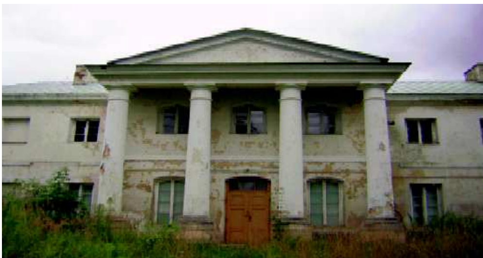
Fot. 1. Pałac w Osmolicach .