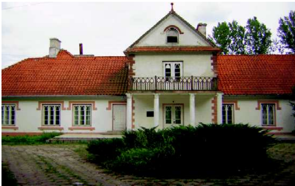
Fot. 7. Pałac w Piotrowicach .

– zespół dworsko-pałacowy w Piotrowicach