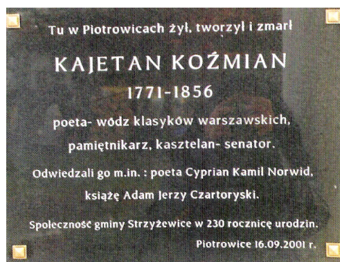
Fot. 8. Tablica pamiątkowa poświęcona Kajetanowi Koźmianowi w Piotrowicach .

W ostatnich latach w jednej z sal założono muzeum poświęcone pamięci Kajetana Koźmiana.