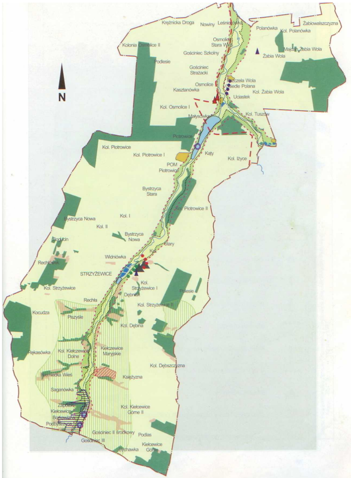
Rys. 2. Mapa gminy Strzyżewice z zaznaczonymi nazwami miejscowości i większymi przysiółkami.