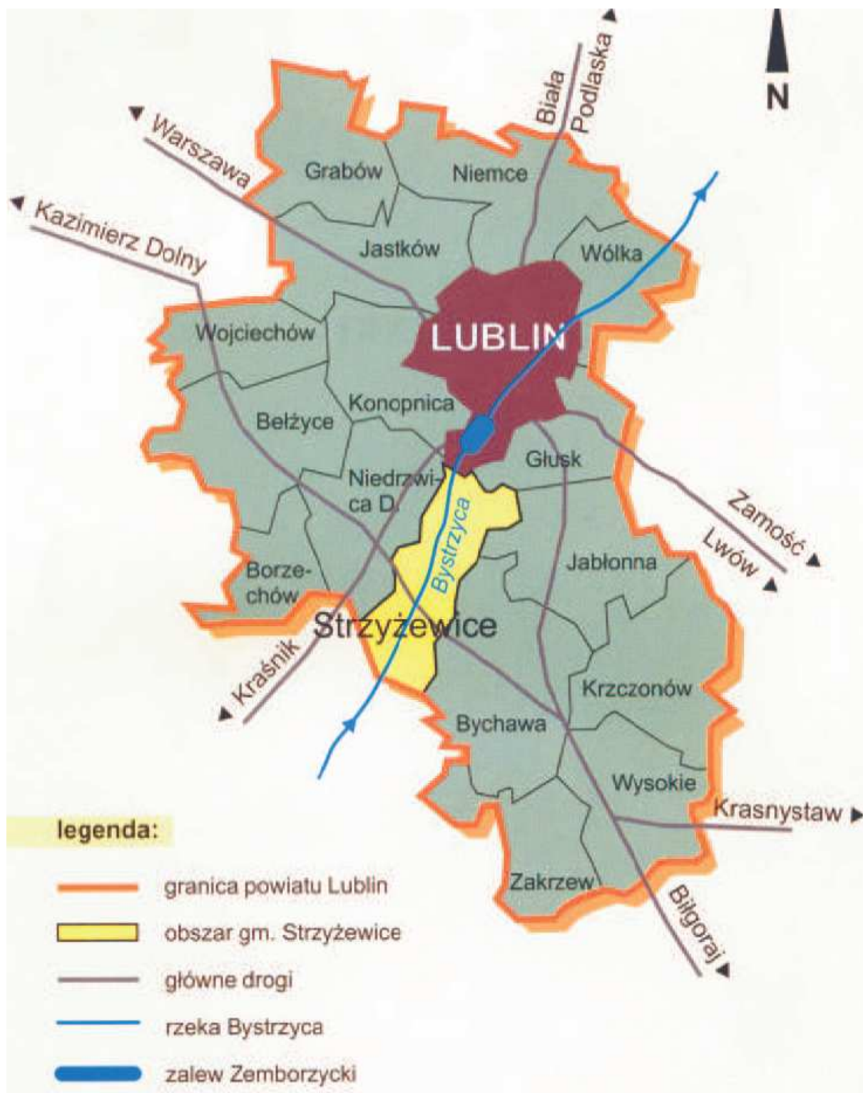
Rys. 1. Położenie geopolityczne gminy Strzyżewice .