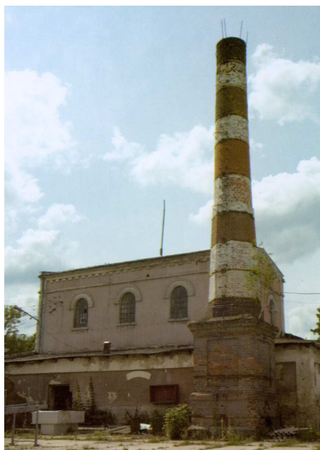
Fot. 3. Dawna gorzelnia w Osmolicach .