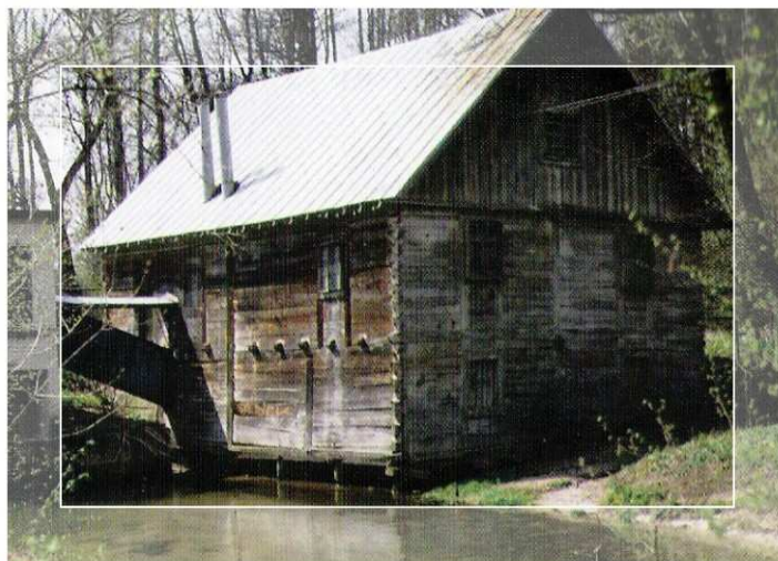
Fot. 4. Młyn w Osmolicach .