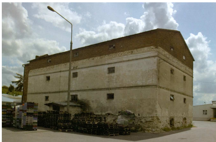
Fot. 2. Spichlerz podworski w Osmolicach .

Powstanie spichlerza datowane jest na 1847 rok. Wzniesiony został przez hrabiego Juliusza Stadnickiego. Rozbudowany na początku XIX wieku. To trzypiętrowy budynek wolnostojący, założony na rzucie prostokąta. Po II wojnie światowej dobudowana została do niego suszarnia chmielu. Obecnie znajduje się na terenie zakładu Osmofrost.