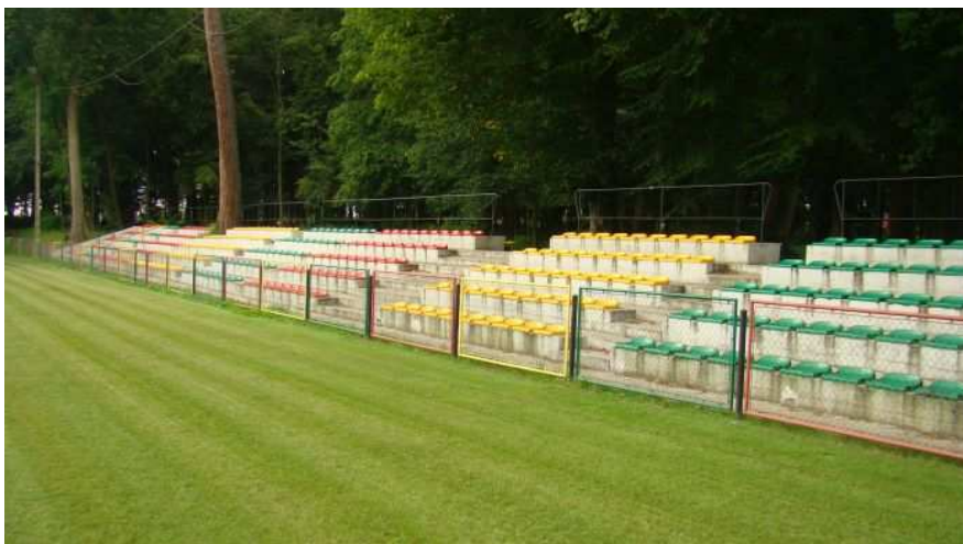
Fot. 12. Stadion sportowy w Piotrowicach .