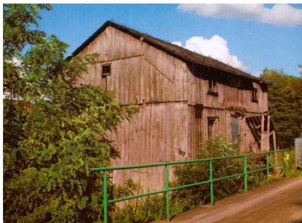
Fot. 10. Młyn wodny w Piotrowicach .