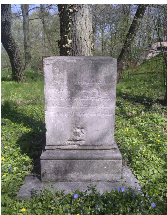
Fot. 5. Resztki figury poświęconej Marii z Grabowskich Stadnickiej.

Obecnie bardzo zniszczony i zdekompletowany znajduje się w Pszczelej Woli obok pawilonu pszczelarskiego.