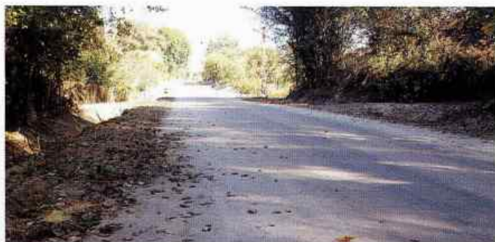
Droga w Dębnie