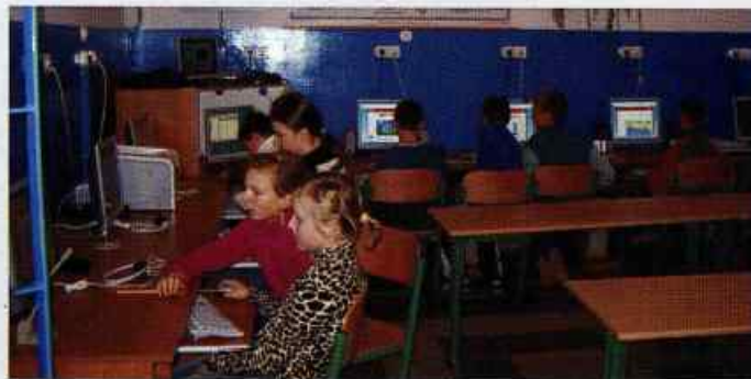
Nowoczesna pracownia informatyczna w SP Żabia Wola