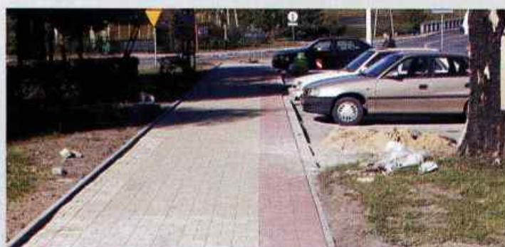
Chodnik Strzyżewice - Bystrzyca Nowa