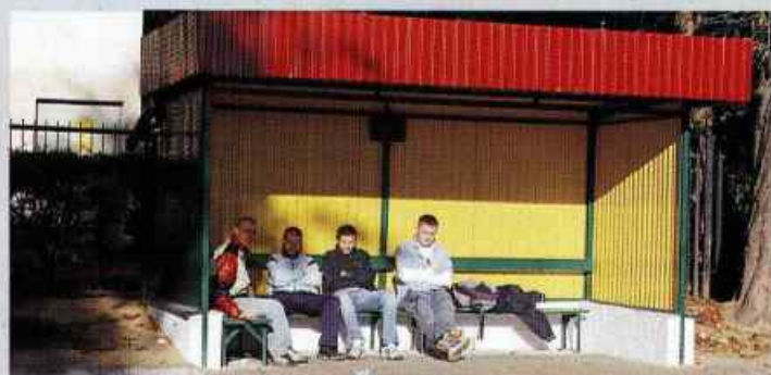
Przystanki autobusowe w barwach gminy