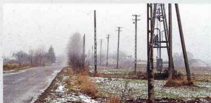
Oświetlenie uliczne w Kiełczewicach Górnych