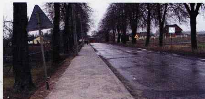
Chodnik Żabia Wola-Polanówka