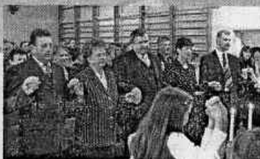
Budowniczy drogi- wspólne działanie przyniosło efekty