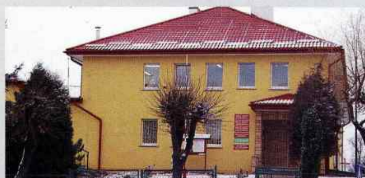
Urząd Gminy - odnowiona elewacja w barwach gminnych