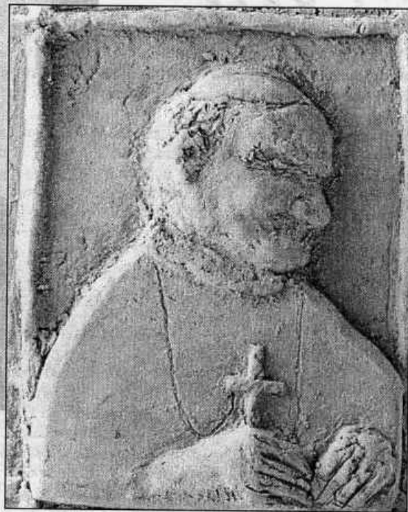
Emilia Rozdziałik - płaskorzeźba, kl. I Gimnazjum w Bystrzycy St.