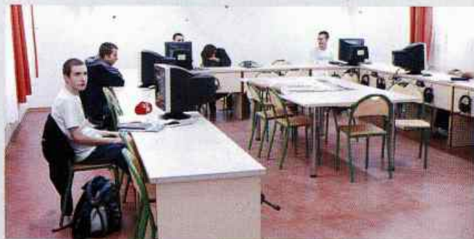
Pracownia multimedialna - Zespół Szkół w Bystrzycy Starej