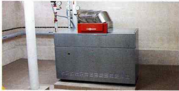
Kotłownia gazowa w Szkole Podstawowej w Kielczewicach