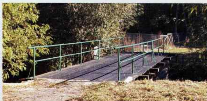
Most w Piotrowicach, jeden z czterech wyremontowanych