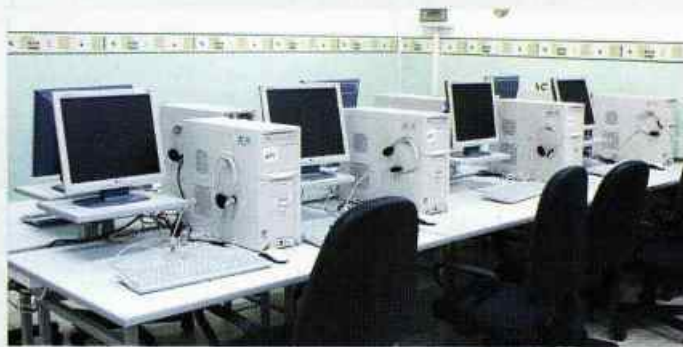
Nowoczesna pracownia w SP Kielczewice