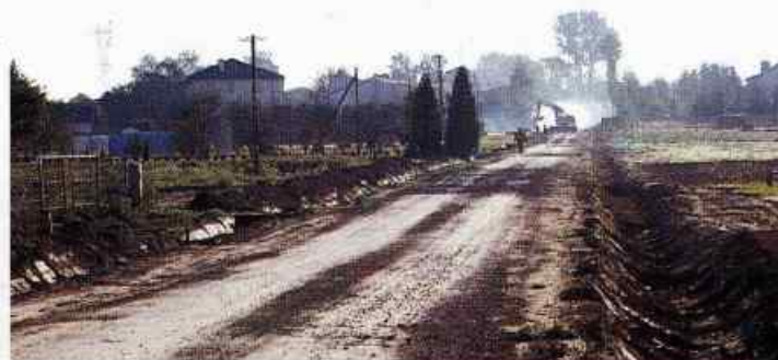
Droga w Żabiej Woli w trakcie budowy