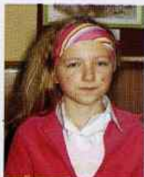
Izabela Wojtyła SP w Osmolicach