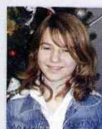
Agata Tracz Gimnazjum w Bystrzycy Starej