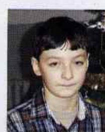
Mateusz Stelmasiewicz SP w Bystrzycy Starej