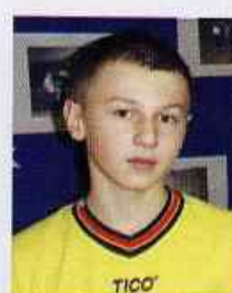
Arkadiusz Ciołek SP w Bystrzycy Starej