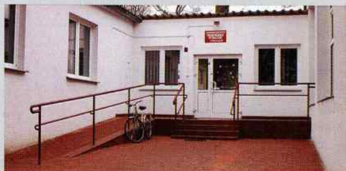
Odnowiona elewacja oraz nowy podjazd przy Przedszkolu