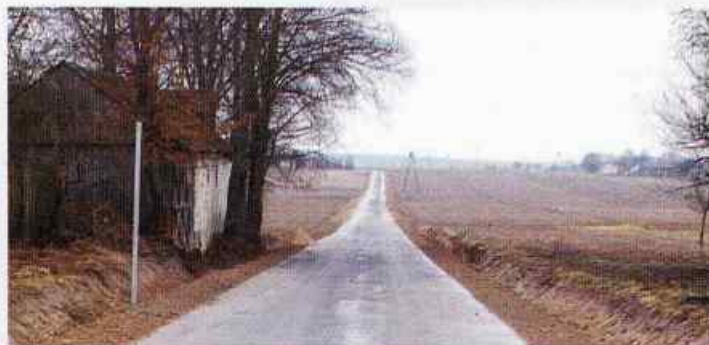
Szoza w Osmolicach II