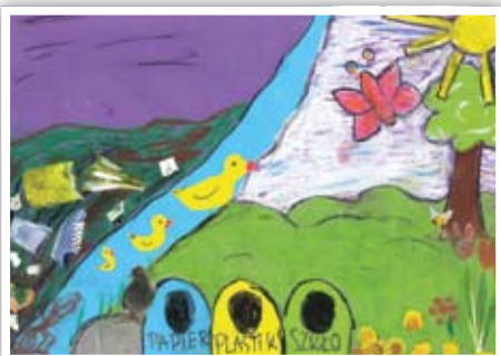
Maja Rudnicka ZSP w Bystrzycy Starej