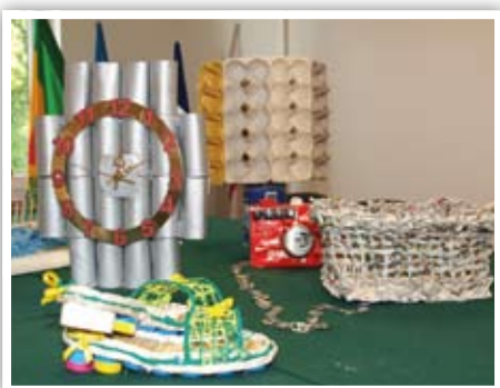
Prace wykonane w ramach konkursu „Eko-rzeczy, czyli ze starego coś nowego”.