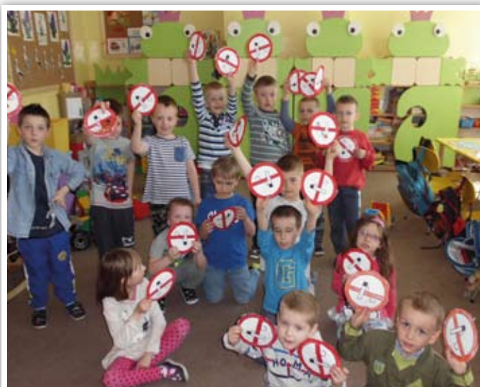
U nas się nie pali

Natomiast nasze dzielne pierwszaki wspólnie ze swoimi rodzicami realizowały program „Moje dziecko idzie do szkoły”, którego głównym celem było podniesienie poziomu wiedzy rodziców na temat wybranych elementów zdrowego stylu życia, ich roli w kształtowaniu prawidłowych nawyków prozdrowotnych u dzieci oraz ich przekonanie o słuszności podejmowanych działań profilaktycznych zarówno w domu, jak i w środowisku szkolnym. Tematyka programu obejmowała: żywienie dziecka w wieku szkolnym, higienę jamy ustnej, ochronę wzroku dziecka, prawidłowy rozwój mowy, zdrowie psychiczne, prawidłową postawę, środowisko szkolne oraz bezpieczeństwo dziecka. We wrześniu rodzice zostali zapoznani z tematyką