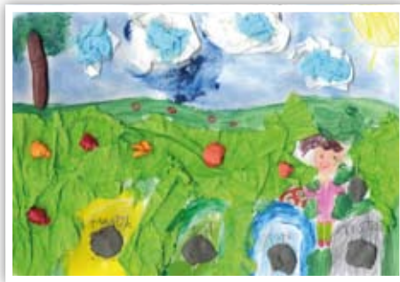
Julia Łomarska ZSP w Bystrzycy Starej