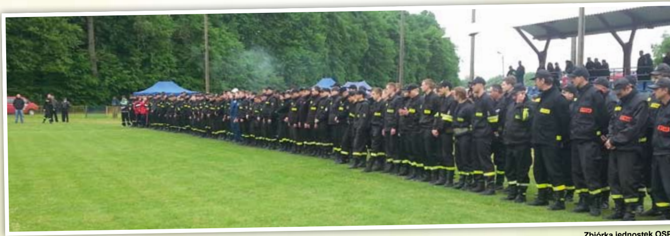
Zbiórka jednostek OSP