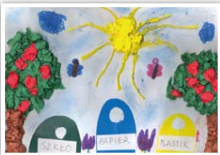
Bartłomiej Wilkołaski ZSP w Bystrzycy Starej

Prace plastyczne wykonane w ramach konkursu „Odpady - wiem jak z nimi postępować”