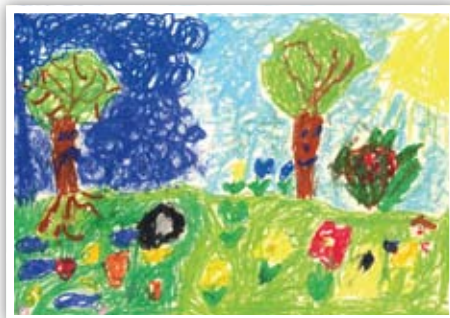
Błażej Grzywa PSP w Kielczewicach Górnych