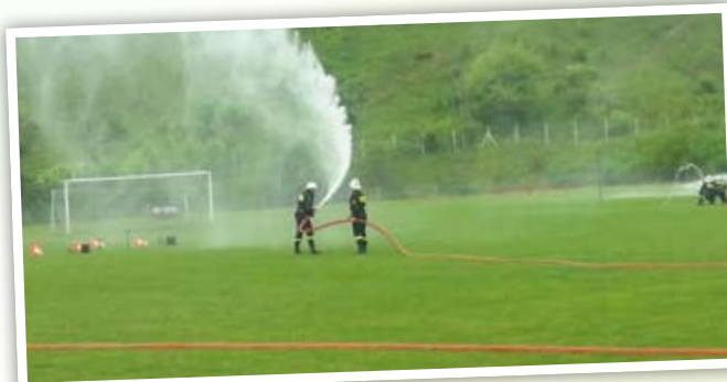
By wykonać zadanie należy przewrócić pacholki strumieniem wody