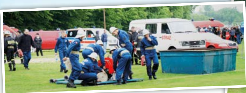
Przygotowanie sprzętu do ćwiczeń bojowych