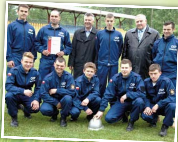
Zwycięska drużyna OSP Pawłów wraz z Wójtem Gminy i Komendantem Gminnym OSP