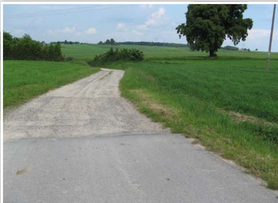
Droga w Pawłótku zostanie przebudowana na odcinku 260m

Zespole Szkół Publicznych w Bystrzycy Starej. Ostatni etap budowy polegał na wykonaniu robót przy budynku zaplecza socjalnego (wewnętrzne instalacje: elektryczna, gazowa, c.o., wodno – kanalizacyjna, ciepłej wody z cyrkulacją, wentylacji mechanicznej, roboty wykonawcze wewnątrz i na zewnątrz budynku), budowie przyłączy: kanalizacyjnego, wodociągowego, gazowego i zewnętrznej instalacji elektrycznej, wykonaniu chodników, ogrodzenia, przebudowy drogi gminnej do wjazdu na teren kompleksu (ułożenie nawierzchni z płyt betonowych ażurowych), wykonanie trawników.