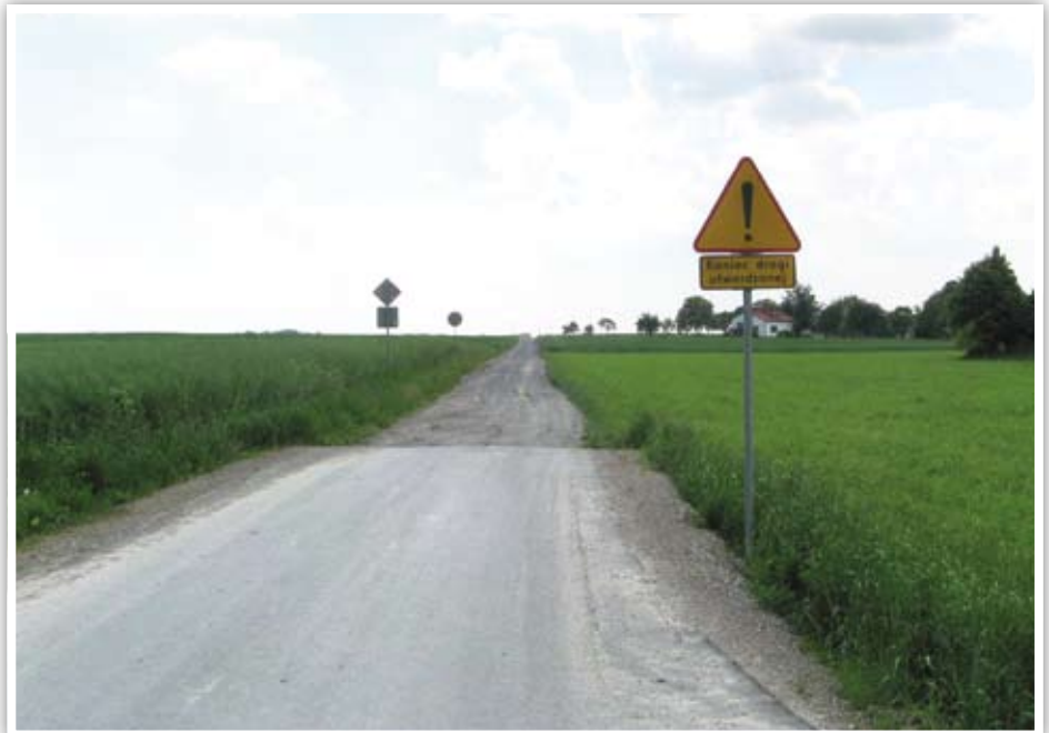
Do połowy lipca powstanie nowy odcinek drogi w Kielczewicach Górnych.

Zakończyły się roboty przy budowie kompleksu boisk sportowych wraz z zapleczem socjalnym (budynek sanitarno – szatniowy) przy