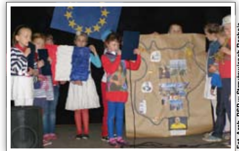
Francja w klasie II