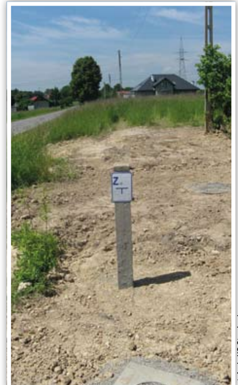
Nowa sieć wodociągowa w Żabiej Woli i Polanówce